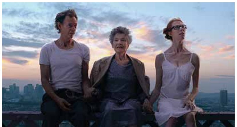
Paris Pieds Nus