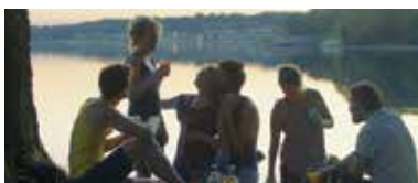
Even Lovers Get the Blues