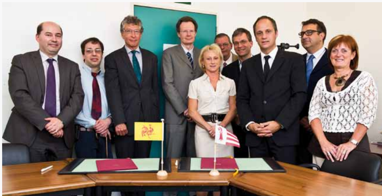
Les participants à la CMP Wallonie-Bruxelles/Jura

La 11 ème session de la Commission mixte permanente entre le Gouvernement de la Communauté française de Belgique et le Gouvernement de la République et Canton du Jura s'est tenue le 17 mai 2011 à Bruxelles.