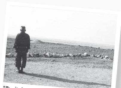
"Territoire perdu" de Pierre-Yves Vandeweerd