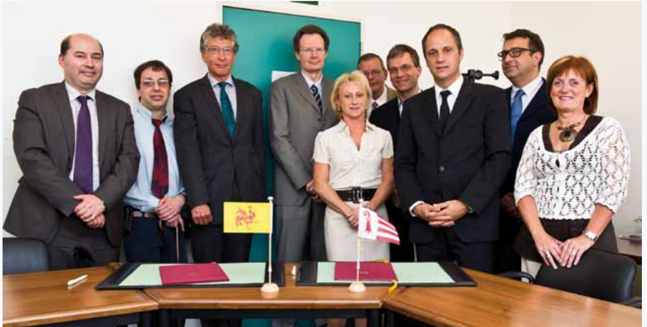
Les participants à la CMP Wallonie-Bruxelles/Jura

La 11 ème session de la Commission mixte permanente entre le Gouvernement de la Communauté française de Belgique et le Gouvernement de la République et Canton du Jura s'est tenue le 17 mai 2011 à Bruxelles.