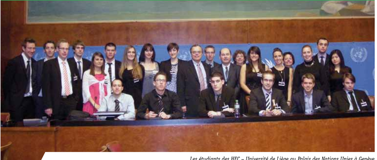
Les étudiants des HEC – Université de Liège au Palais des Nations Unies à Genève