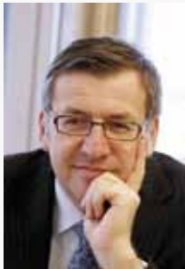
Steven Vanackere, Ministre belge des Affaires étrangères

L'Examen Périodique Universel (EPU) est un processus unique en son genre qui a débuté en 2008. Il consiste à passer en revue, tous les quatre ans, les réalisations de l'ensemble des 192 Etats membres de l'ONU dans le domaine des droits de l'Homme (48 Etats sont examinés par année lors de 3 sessions de l'EPU de 16 pays chacune).