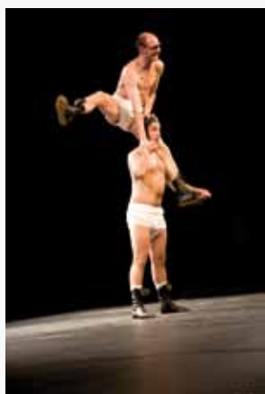
La Compagnie Okidok