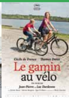
« Le gamin au vélo » de Jean-Pierre et Luc Dardenne