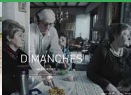
« Dimanches » de Valéry Rosier