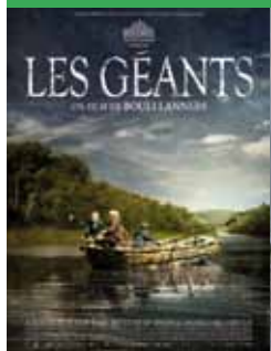
« Les géants » de Bouli Lanners