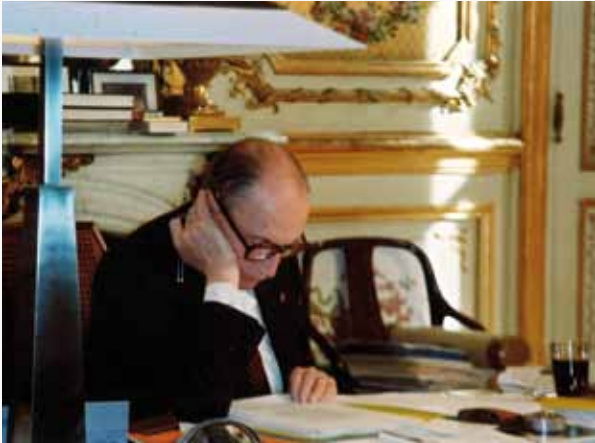
« Le Prince et son image » d'Hugues Le Paige

Wallonie-Bruxelles a présenté 6 réalisateurs au Festival international de cinéma « Visions du Réel », festival consacré au film documentaire, qui s'est déroulé à Nyon du 7 au 13 avril 2011. Cette présence était appuyée par Wallonie-Bruxelles Images, l'agence officielle pour la promotion de l'exportation de l'audiovisuel belge francophone.