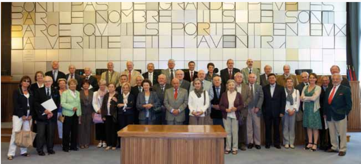
L'Association des anciens parlementaires francophones au Conseil régional de la Vallée d'Aoste.

Une délégation de l'Association des anciens parlementaires francophones (AAPF) a effectué une visite en Vallée d'Aoste du 8 au 13 mai. Cette association, qui regroupe d'anciens parlementaires belges francophones, se rend régulièrement en visite dans un pays ou une région.