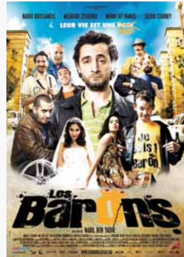
« Les Barons » de Nabil Ben Yadir