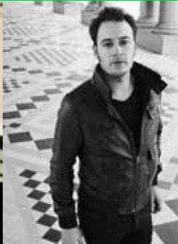
Coco Royal