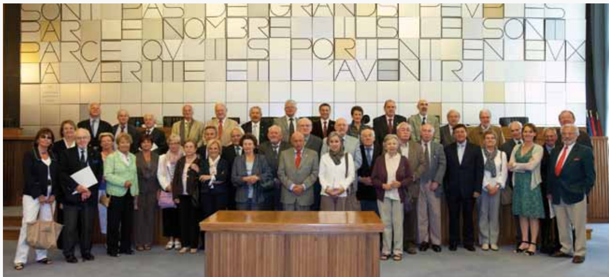
L'Association des anciens parlementaires francophones au Conseil régional de la Vallée d'Aoste.

Une délégation de l'Association des anciens parlementaires francophones (AAPF) a effectué une visite en Vallée d'Aoste du 8 au 13 mai. Cette association, qui regroupe d'anciens parlementaires belges francophones, se rend régulièrement en visite dans un pays ou une région.