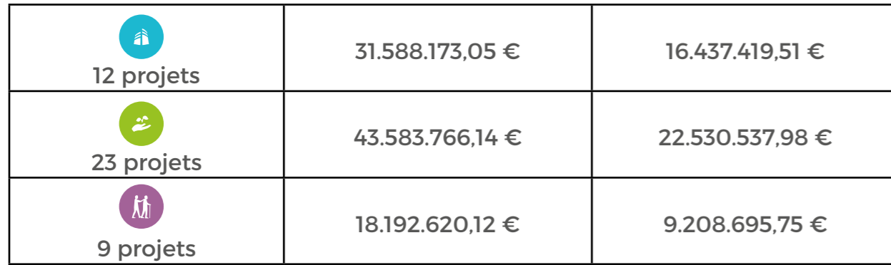
1ER APPEL À PROJETS : RÉPARTITION DES BUDGETS PAR AXE 1STE PROJECTOPROEP: VERDELING VAN DE BUDGETTEN PER PRIORITEIT