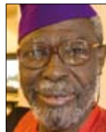
MOUSTAPHA ALLASSANE NIGER Réalisateur