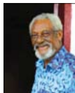
PHILIPPE MORY GABON Comédien Réalisateur, Père du cinéma gabonais