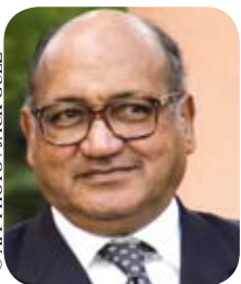
Feu Henri DUPARC

Le premier court métrage "Concerto pour un exil" réalisé en 1967 par l'ivoirien Désiré ECARE obtient plusieurs prix et apporte ainsi la première consécration cinématographique à la Côte d'Ivoire. Trois autres films sont produits en 1969 : "Mouna ou le rêve d'un artiste" d'Henri DUPARC, "A nous deux France" de Désiré ECARE et le tout premier long métrage ivoirien "La femme au couteau" de Timité BASSORI.