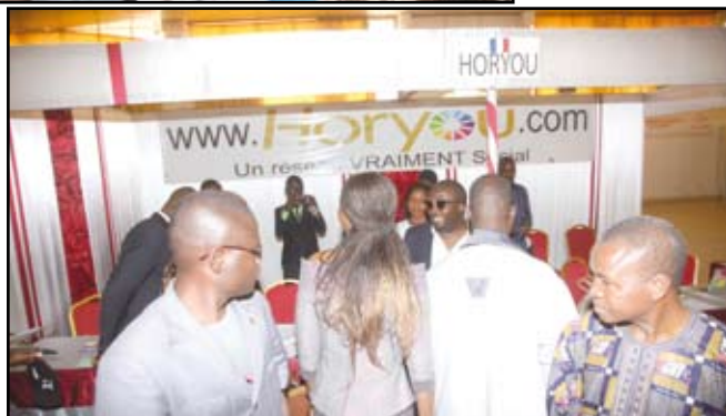
Vues sur le marché du film 2015