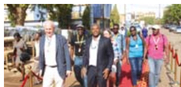
Tapis rouge pour les professionnels à la cérémonie d'ouverture professionnelle

Outre la grande cérémonie officielle d'ouverture, le FESPACO procède également à l'ouverture professionnelle de la compétition des films. Cette cérémonie est dédiée aux professionnels du cinéma.