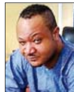
MUNA OBIEKWE NIGERIA Comédien