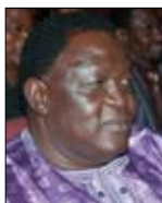
MATHIAS BAYILI BURKINA FASO Comédien