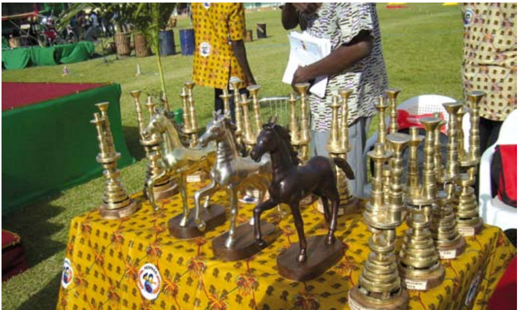
Poulains d'Or, d'argent, de bronze et les autres trophées du FESPACO