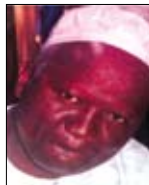
MAMBAYE COULIBALY MALI Réalisateur Précurseur du cinéma d'animation africain