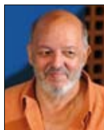
MOHAMED KHAN EGYPTE Réalisateur