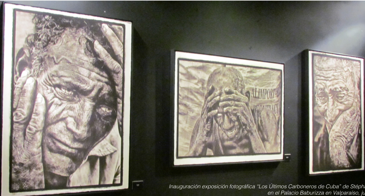
Inauguración exposición fotográfica “Los Últimos Carboneros de Cuba” de Stéphane Noël en el Palacio Baburizza en Valparaíso, julio 2019.

La exposición llegó a Chile gracias al apoyo de la Delegación general Valonia-Bruselas en Chile y de la curadora Verónica Besnier. La primera inauguración se realizó en la Corporación Cultural de Las Condes, Santiago en marzo 2019 para ser posteriormente exhibida en el Palacio Baburizza en Valparaíso desde julio 2019. Su destino siguiente fue la Pinacoteca de la Universidad de Concepción (UdeC), desde la cual se realizó un catálogo y una inauguración virtual dado la pandemia de Covid-19. La gira nacional de la exposición debería terminar en el Centro de Extensión de la Universidad Católica del Maule (UCM) en Talca. Las fechas quedan por confirmar aún, debido al contexto sanitario.