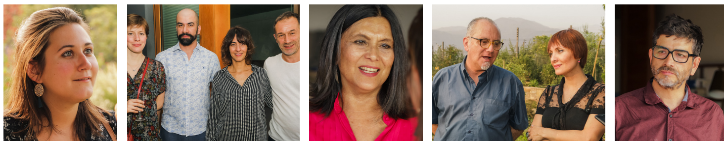
Recepción cultural con la participación de: Centro Cultural Lo Prado, Fundación Teatro a Mil, Balmaceda Arte Joven, IFO producciones, Teatro del Espejo, Théâtre National Wallonie-Bruxelles, Théâtre Cœur de Terre y Les Baladins du Miroir, enero 2020.