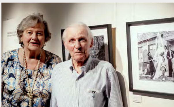
▲ Inauguración de la exposición Habitando el viento Inauguration de l'exposition Habitando El Viento .