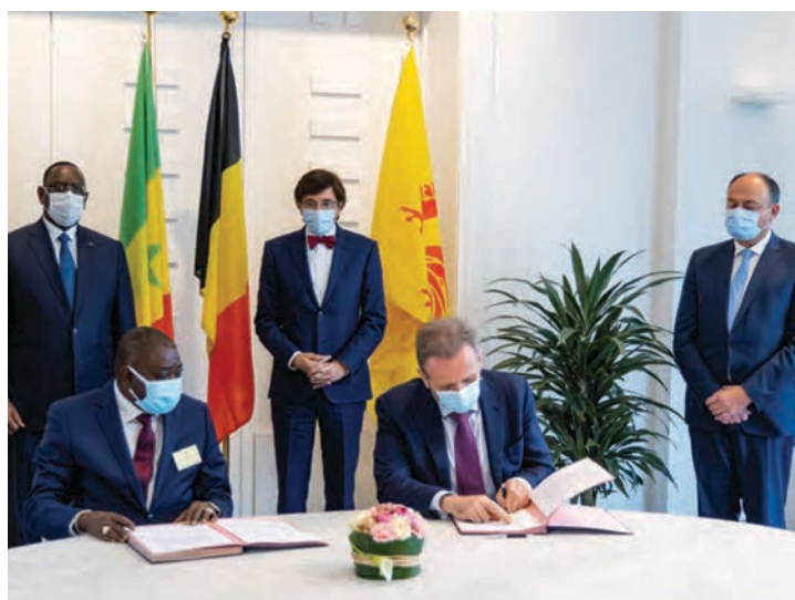
Signature de la lettre d'intention entre l'IRESSEF et Univercells

Ces différents partenariats permettent d'envisager l'avenir des relations bilatérales avec le plus grand optimisme pour nos artistes, producteurs, industriels et pour nos populations respectives, et il est sûr que ces relations se renforceront encore à l'avenir.