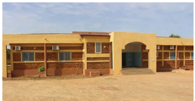
Vue du CNRMPR