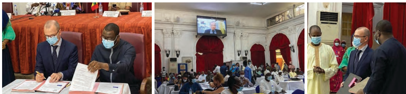
Cérémonie des signatures du partenariat Union européenne-APEFE pour le projet Archipelago

La formation professionnelle est un enjeu fondamental afin d'élargir les perspectives de la jeunesse et de l'économie sénégalaise.