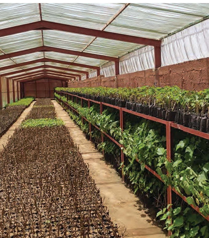
La pépinière de l'usine de Bandia

L'objectif est de produire sur place la chaux nécessaire aux besoins de la zone Afrique de l'ouest. Tout en veillant en parallèle au bien-être du personnel et des communautés locales, via les emplois de qualité créés, un site de maraîchage, un point d'eau pour les éleveurs, un verger, et de la production de biomasse (combustible).