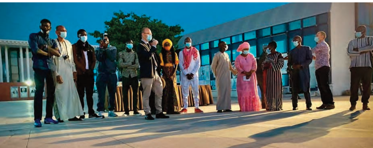
Expo Littoral, avec l'équipe de création

Merci à tous ceux qui ont rendu cela possible. Elle a été présentée jusqu'au 10 janvier 2021.