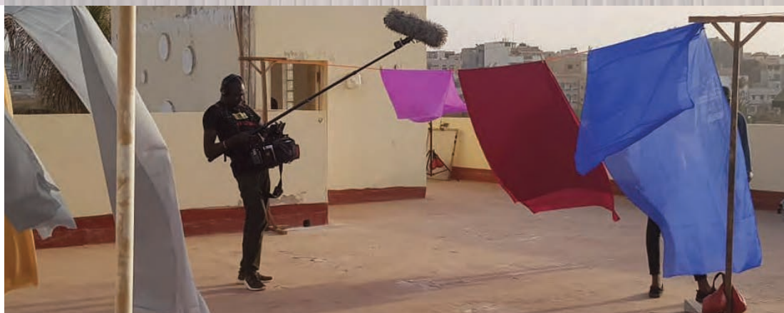
L'équipe de tournage

7 JOURS POUR UN FILM, WALLONIE BRUXELLES - SENEGAL SOUTIENT LES JEUNES ESPOIRS DU CINÉMA AFRICAIN