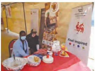
Le stand de la Délégation générale

Enfin nos remerciements aux personnels de la Délégation générale Wallonie-Bruxelles et de l'ambassade de Belgique ainsi qu'aux femmes entrepreneurs soutenues par l'Apefe et WBI d'avoir animé nos stands et fait découvrir leurs productions de qualité au public dakarois. Les fonds récoltés serviront à soutenir des association d'aides aux plus démunis.