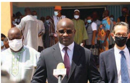
Le Ministre de la Santé, le Pr.Charlemagne Ouedraog