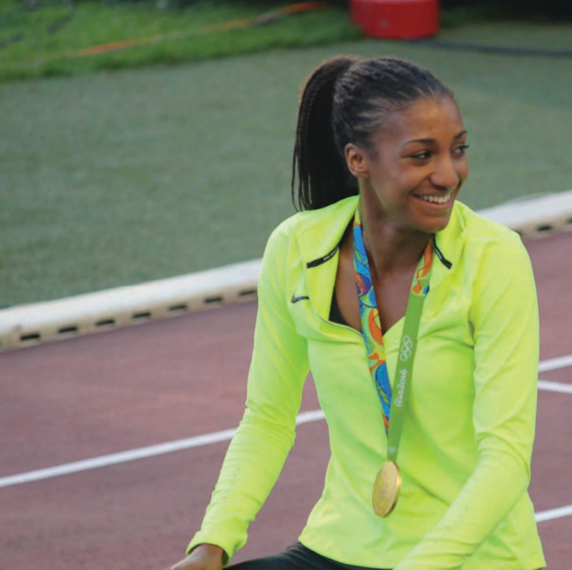
“Brussels, Memorial Van Damme, Nafissatou Thiam”