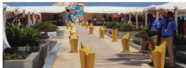
Place du Souvenir