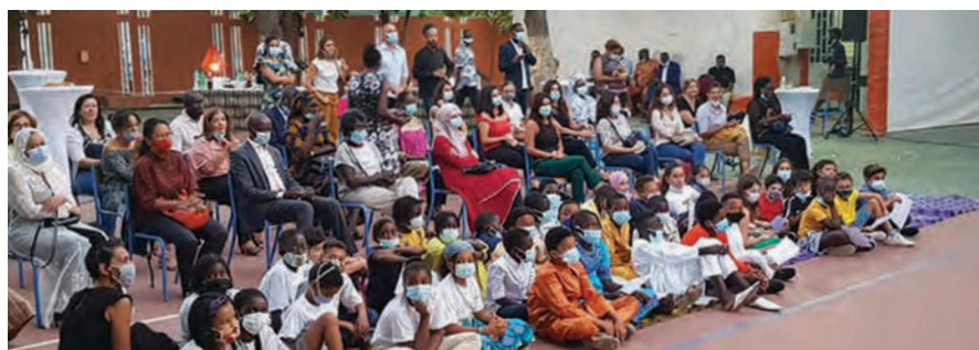
Lancement du Festival 10sur10 Sénégal 2021 à l'école franco-sénégalaise Dial Diop