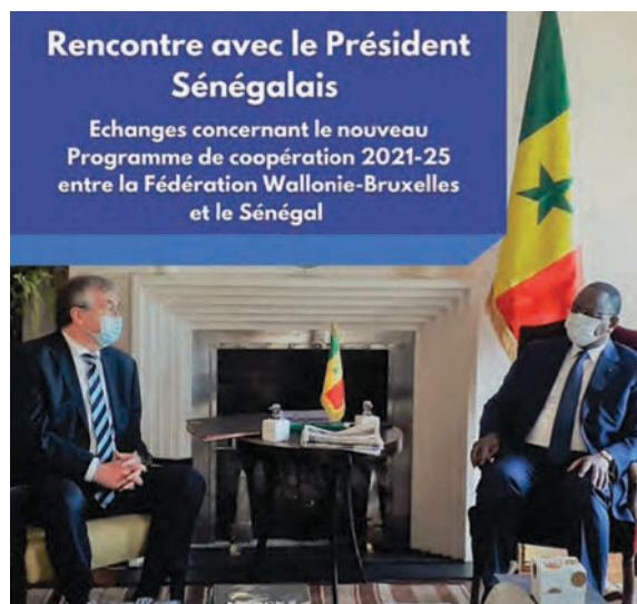
Rencontre bilatérale du Président M. Sall avec le Ministre Président de la Fédération Wallonie Bruxelles PY Jeholet