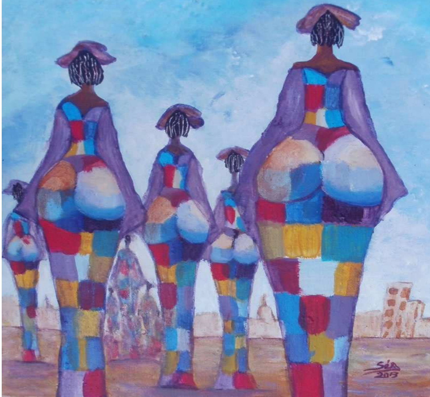
Retour des Jongomas II, Sésa 2013