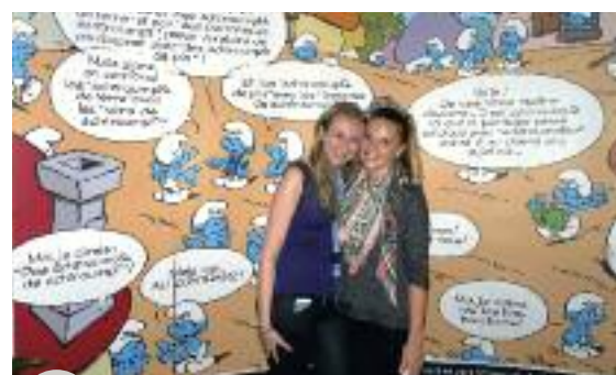
Schtroumpf l'amitié à la FBL!