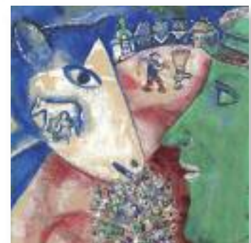
Marc Chagall, Moi et le village , 1912

Musées royaux des Beaux-Arts de Belgique