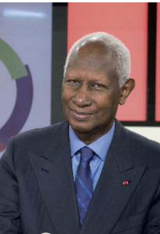
SEM le président Abdou Diouf

Ces témoignages ont été suivis par les remerciements et une allocution empreinte de dignité, de sagesse et de passion du Président Abdou Diouf, une personnalité qui continue de marquer profondément son espace et son temps.