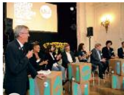
Les artistes et commissaires d'exposition à la disposition de la presse dans la bonne humeur