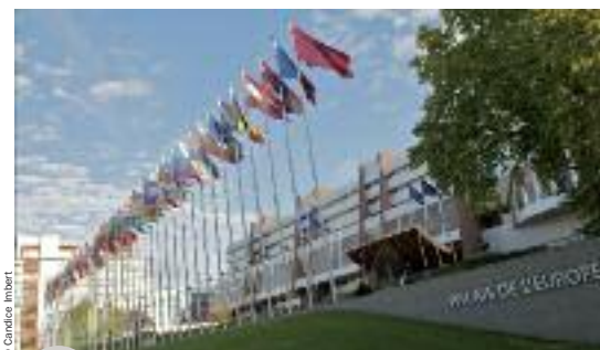
Le Conseil de l'Europe sous présidence belge

La Belgique assure la présidence du Conseil de l'Europe depuis le 14 novembre 2014, pour une période de 6 mois. Outre des sujets importants tels que la réforme de la Cour européenne des Droits de l'Homme, cette présidence permettra à la Belgique de présenter à Strasbourg une cinquantaine de manifestations destinées à promouvoir les multiples facettes du génie belge, qu'il soit wallon ou flamand, bruxellois ou germanophone... dans des domaines aussi divers que la musique, le cinéma, l'opéra, le théâtre ou la gastronomie, illustrés par de nombreux spectacles, expositions et projections. Tous ces événements sont repris dans une plaquette spéciale « La Belgique donne le tempo », éditée en collaboration avec la Communauté urbaine de Strasbourg.