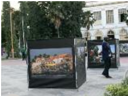
Exposition à l'hôtel de Ville de Dakar