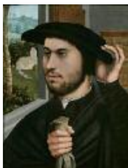
Ambrosius Benson, Portrait of a Man , c. 1530, huile sur bois. Private Collection.

À la Renaissance, l'art du portrait a connu un essor sans précédent. Les œuvres d'art sont aussi le sujet de longues recherches scientifiques, comme l'illustre cette première grande exposition depuis cinquante ans.