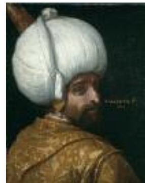
Veronese, Nachfolge - Sultan Bajezid

L'exposition montre l'attrait qu'exerça le Proche-Orient auprès des artistes occidentaux et souligne l'influence du monde islamique sur la pensée de la Renaissance. Avec des œuvres de Bellini, Carpaccio, Dürer, Titien et autres.