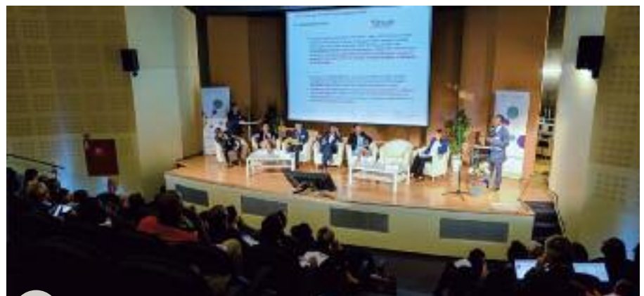
Le plateau du 1 er Forum francophone de l'innovation à Namur