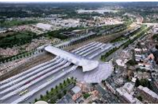
La nouvelle gare de Mons, œuvre de Santiago Calatrava

Du 18/10/2015 au 17/01/2016 MAC's www.mac-s.be