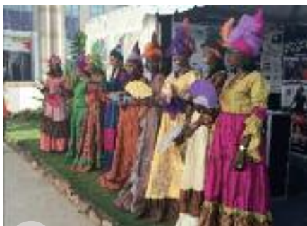
Accueil au Village de la Francophonie