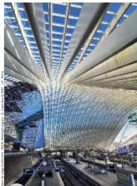
Liège accueillera la Conférence mondiale des humanités en 2017

La cérémonie de décoration s'est tenue à la Délégation Générale Wallonie-Bruxelles en présence de nombreux invités de marque le 4 décembre 2014.