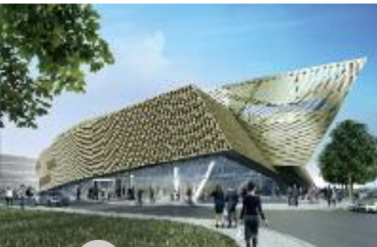
MICX, Mons International Congress Xperience, signé Daniel Libeskind