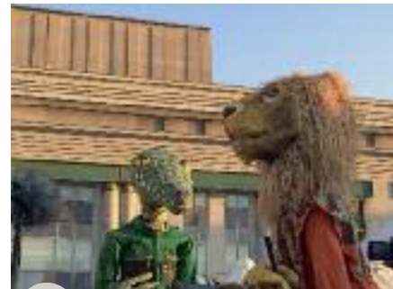
Fête sur le village

La « Déclaration de Dakar » réaffirme cette neutralité et une résolution rappelle l'importance du numérique dans l'expression de la diversité culturelle. Jeunesse, femmes, économie, innovation, éducation, formation, santé, diversité culturelle, autant de priorités politiques de la Fédération Wallonie-Bruxelles au plan intérieur et qui sont aussi les priorités de la Francophonie.