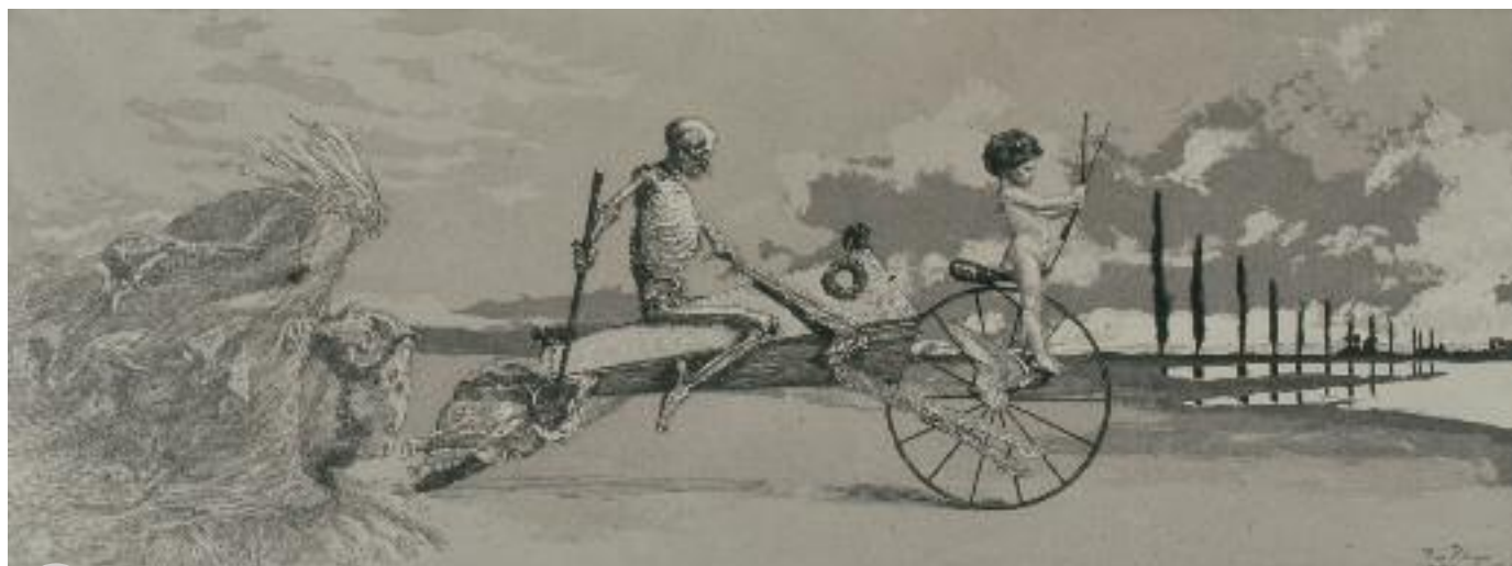
Max Klinger, Amor Tod und Jenseits (Amour, Mort et Au-delà) , cycle Intermezzi. Opus IV , 1879-81 eau-forte et aquarelle. Collection du Muzeum Narodowe w Poznaniu.