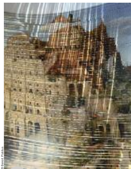
Œuvre de Benoit Platéus pour l'exposition «Atopolis»

au combat légendaire entre saint Georges et le Dragon et qui, dans la ferveur populaire, fait trembler le pavé montois. C'est aussi un clin d'œil à Sainte-Waudru, la procession du Car d'Or, les chanoinesses et l'invitation à visiter la collégiale.