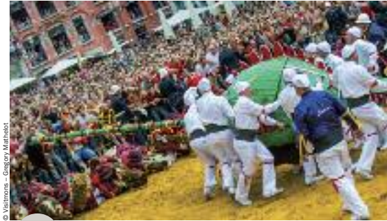
La Ducasse de Mons, reconnue par l'Unesco en 2005, aura son musée en 2015