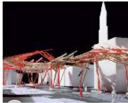
The Passenger d'Arne Quinze pour cinq ans à Liège