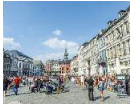
Mons 2015 vise les 2 millions de visiteurs