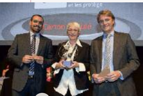
Les gagnants de l'Oscar de l'emballage

Dans le cadre du Salon de l'Emballage qui se tient tous les 2 ans à Paris, l'Awex était présente et apportait son soutien à une collectivité de près de