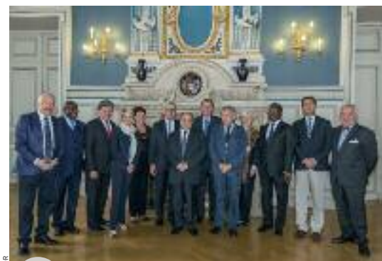
Le Groupe des Ambassadeurs francophones reçu à la mairie de Limoges

Les médias étaient également au programme: une rencontre avec France 3 Limousin, en présence du Directeur de France 3, et des interviews avec France Bleu Limousin ont permis de communiquer largement sur la Francophonie, sur les objectifs du GAFF et sur la réelle implication de tous les acteurs francophones de la région. L'économie était aussi au rendez-vous avec la Chambre de commerce et d'industrie, sans oublier un passage par la célèbre manufacture de porcelaine Bernardaud. Un enchantement! Ce premier déplacement fut assurément un succès.