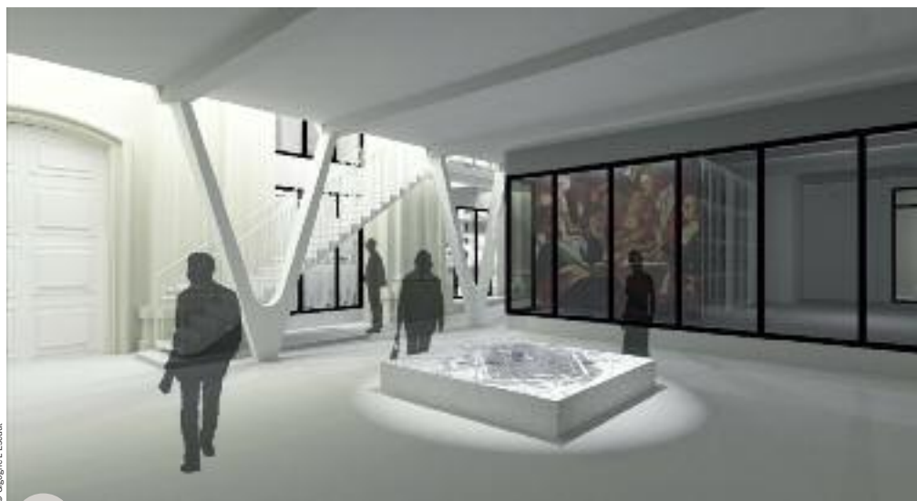
Maquette de la future Arthothèque (Pôle muséal)

Un silex produit des étincelles, dit-on. On est tout feu, tout flammes à l'idée de rejoindre l'homme du néolithique. Rendez-vous sur le site archéologique