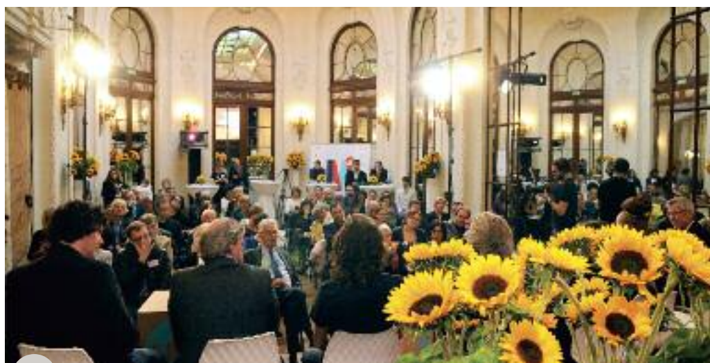
Conférence de presse « ensoleillée »