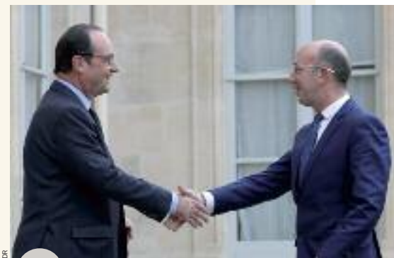
Le Président François Hollande reçoit le Ministre-Président, Rudy Demotte

Au cours de cet entretien cordial, ils sont convenus de poursuivre les concertations sur les questions de politique internationale et d'économie au sein de l'espace francophone ainsi que sur la coopération bilatérale entre la France et la Fédération Wallonie-Bruxelles.