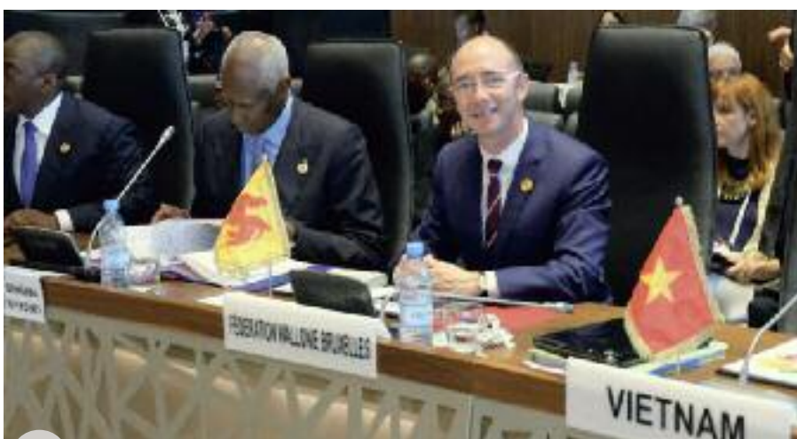
Rudy Demotte, Ministre-Président de la Fédération Wallonie-Bruxelles, aux côtés du président Abdou Diouf, Secrétaire général de la Francophonie

C'est cette convergence qu'a mise en évidence le Ministre-Président de la Fédération Wallonie-Bruxelles, Rudy Demotte, au cours de son intervention et dans les contacts bilatéraux avec plusieurs Chefs d'État et de gouvernement. ●●●