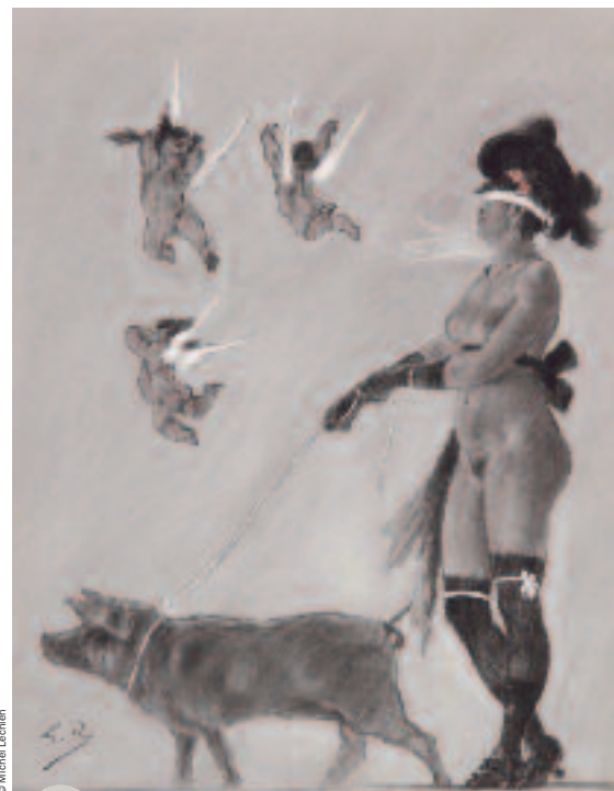
Félicien Rops, Pornokratès, s.d. Dessin original au crayon de couleur Collection du Musée royal de Mariemont

Commissariat : E. Dumesnil, G. Gosselin, psychanalyste, P.-J. Foulon, maître de conférence à l'Université de Liège, et S. Laghouati, conservateur chargé de recherche au Musée royal de Mariemont. Scénographie : Monique Puzat et Jean-Michel Ponty (Adélie Editions). Co-production : Centre Wallonie-Bruxelles à Paris et le Musée royal de Mariemont.