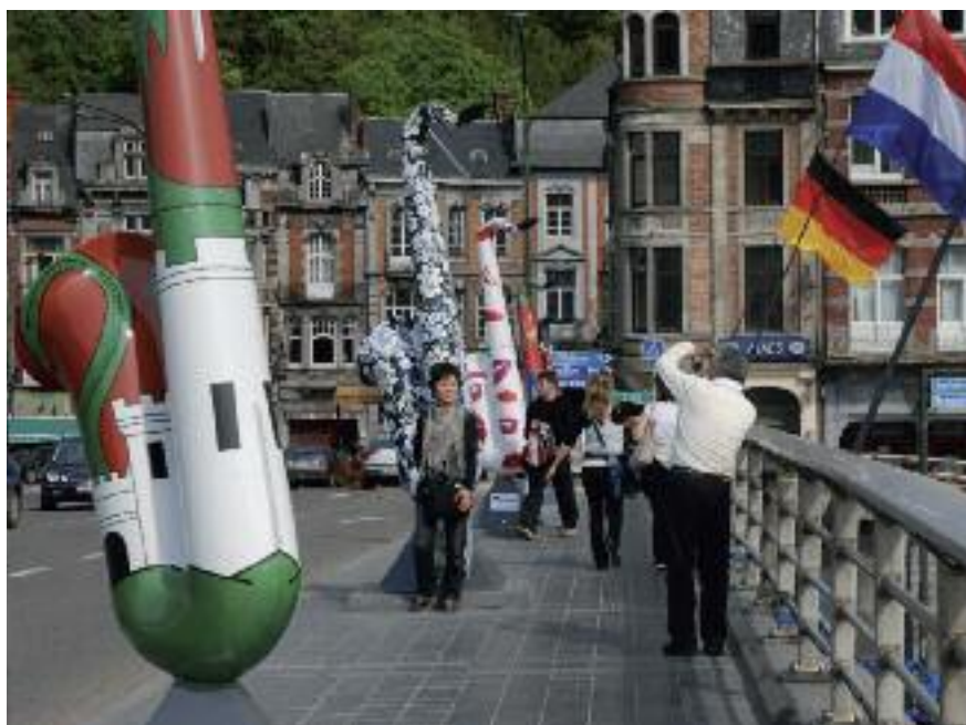
«Art on Sax» à Dinant, ville natale d'Adolphe Sax