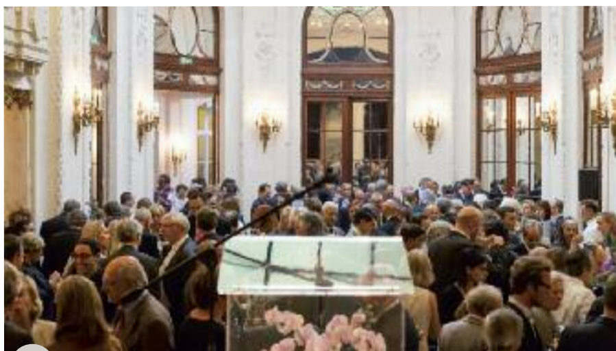
Joyeuse affluence dans la belle salle de réception

Nous nous sommes réjouis également de la présence de la nouvelle Adminis-