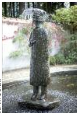
© JM Folon, ADA GP, 2009

Fondation Folon, La Hulpe www.fondationfolon.be