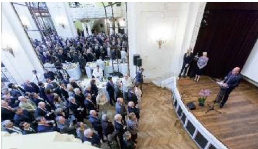
Le discours du Président du Parlement, Philippe Courard

Dans cette démarche, l'éducation à la citoyenneté est importante et c'est pourquoi, il y a 20 ans déjà, le Parlement de la Fédération a soutenu la