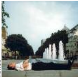
Homme allongé, extrait de la série Acrononia, 1999-2000. C-prints, 70 x 70 cm

L'exposition Bruxelles à l'infini – Collection Contretype, Photographes en résidence présentera du 29 janvier au 24 avril 2016 au Centre Wallonie-Bruxelles une sélection d'œuvres de 29 photographes internationaux, d'horizons divers, provenant de la collection de photographies de l'espace Contretype, réalisées dans le cadre de résidences à Bruxelles. Une invitation à découvrir une collection qui dessine un portrait de la création photographique contemporaine, à travers le regard singulier d'artistes qui ont exprimé ce que la ville leur inspirait mais aussi quelle part de leur propre univers pouvait s'y projeter.