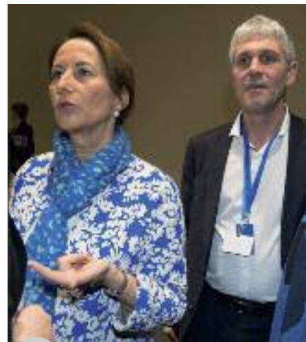
Les ministres Ségolène Royal et Paul Furlan à la coordination européenne

La 21 e Conférence des Parties (COP21) de la Convention cadre des Nations Unies sur le Changement climatique s'est déroulée du 30 novembre au 12 décembre 2015 au Bourget. L'enjeu majeur était de dégager un accord politique contraignant pour inverser la courbe des émissions de gaz à effet de serre et ainsi stabiliser la température moyenne mondiale. L'accord atteint va au-delà de ces attentes, la barre du réchauffement climatique étant fixée en dessous de + 2°C d'ici à 2100 par rapport à l'époque pré-industrielle, avec un engagement de poursuivre les efforts pour le limiter à 1,5°C.