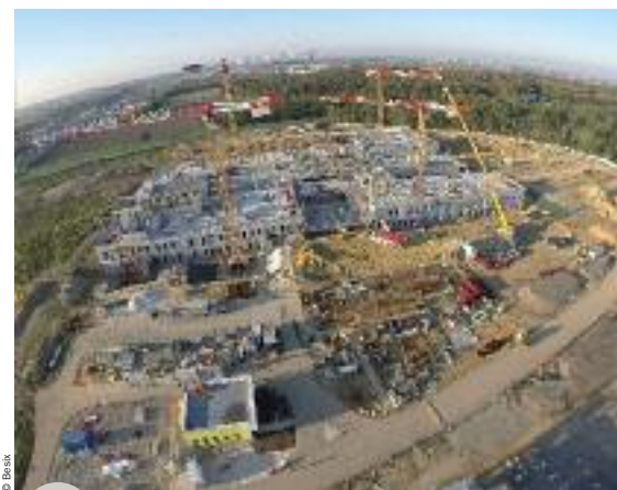
Centre hospitalier Marc Jacquet, Paris-Melun