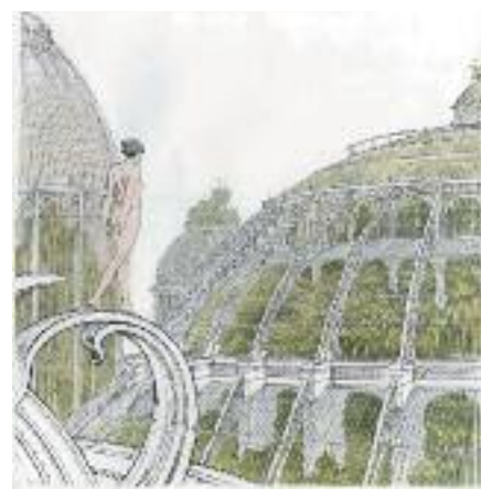
En couverture: «Les serres chaudes». © François Schuiten

Tous nos remerciements vont à François Schuiten pour sa précieuse collaboration.