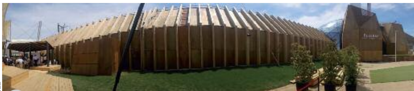
Le pavillon belge de Expo Milan 2015, lauréat du prix « Best Exhibit Expo 2015 », bientôt installé à Namur

taïques. Le toit en sphère de verre était inspiré des Serres royales de Laeken, tandis que l'utilisation d'éléments en bois faisait référence à l'architecture traditionnelle des fermes belges.