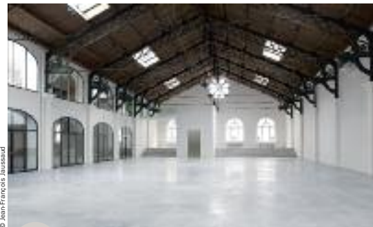
La Patinoire royale