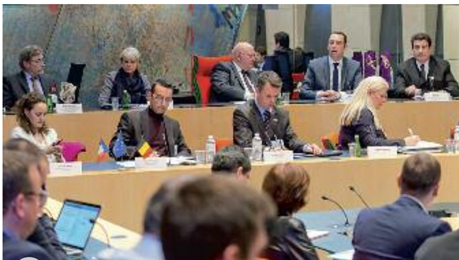
Ouverture officielle de la mission par le Député-Maire André Santini et le Ministre Maxime Prévot

Le Ministre Prévot a présenté au Député-Maire et à la délégation is-