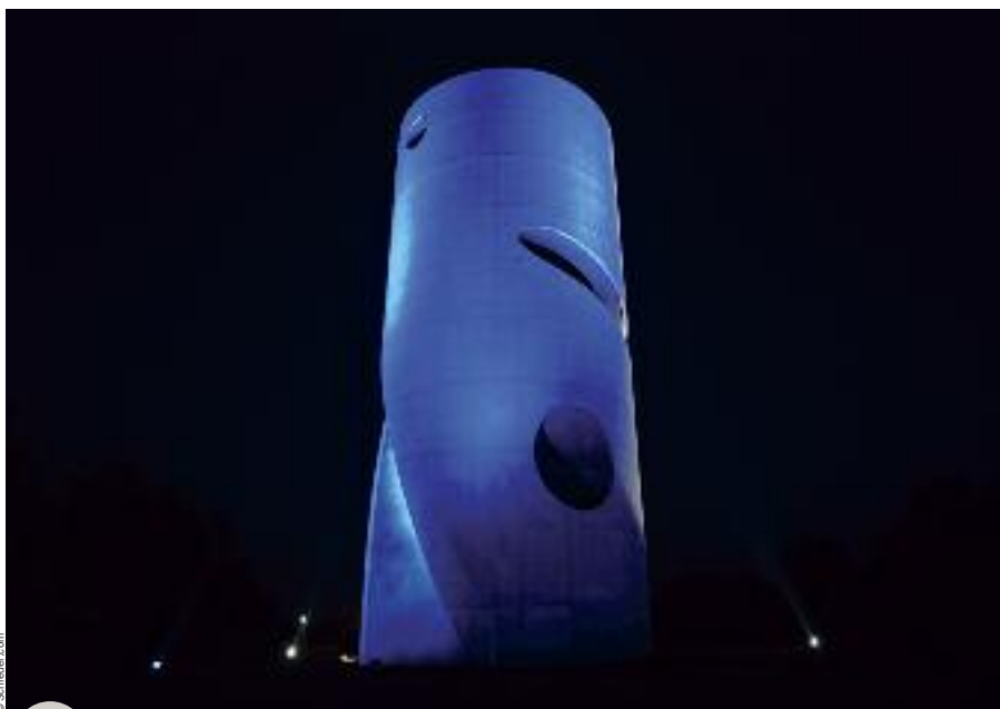
Le château d'eau de Cherbourg-Octeville

Les Champs-Élysées à Paris, le Colisée à Rome, la Grand-Place à Bruxelles, la Riva de Split, la Place des Trois Pouvoirs à Brasilia, le viaduc de Millau et le Bund de Shanghai sont quelques-unes de leurs références. La filiale française de Schröder, Comatelec, vient de remporter un prix pour l'illumination du château d'eau de Cherbourg. L'Association des concepteurs lumière et éclairagistes a en effet récompensé ce projet dans la catégorie conception lumière.