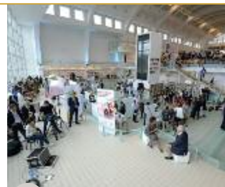
La Cité Miroir bouillonnante de Francophonie

« Ne renoncez pas à vos idéaux, ni à vos rêves. Il faut que vous repartiez de Liège avec la conviction que vous pouvez devenir les architectes d'un monde