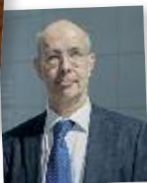
SE l'Ambassadeur Jean-Joël Schittecatte