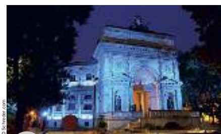
L'Acquario Romano à Rome

La façade du château d'eau, visible de la mer, est éclairée par 6 Neos led en RGB (80 leds) avec changement de couleur. Chaque jour de la semaine est éclairé par une couleur différente :