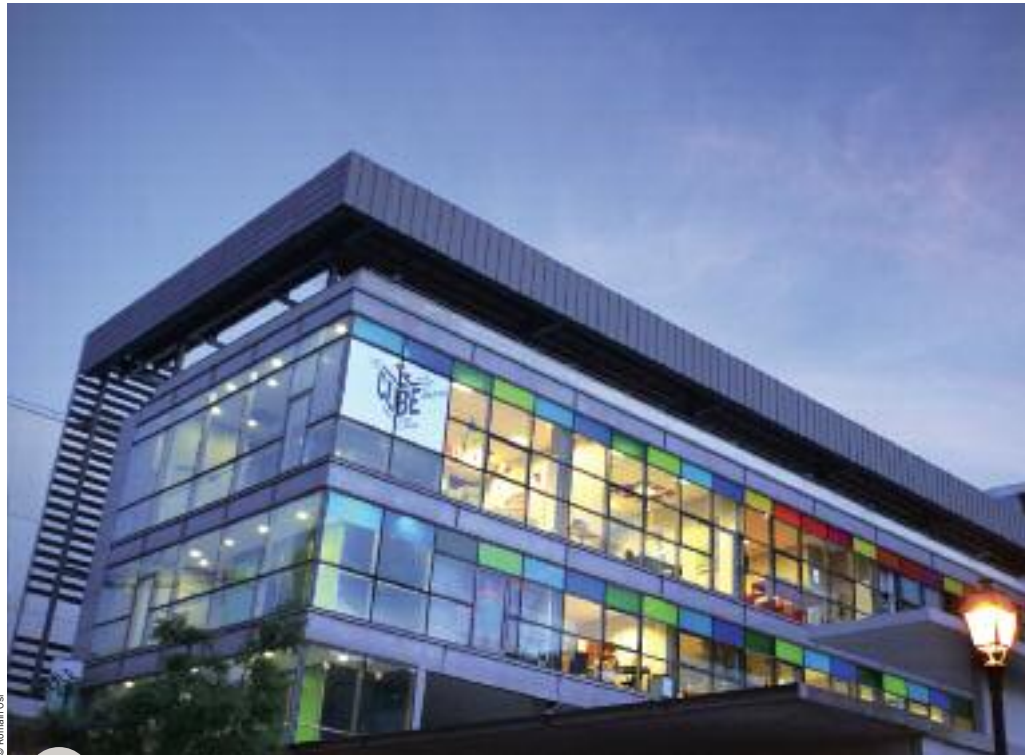
Le Cube, centre de création numérique

Une mission exploratoire qui débouche sur les pistes concrètes de collaboration, dont la première sera notre participation en qualité de partenaire du