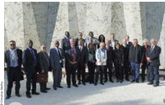
La délégation du Gaff et les représentants de l'Ardèche devant la Caverne du Pont d'Arc

La découverte du patrimoine et des sites exceptionnels a été aussi l'occasion d'échanges au travers de tables rondes avec les représentants de la Région et du Département. La visite de cette région « Silicon Valley de la préhistoire » organisée par le syndicat mixte