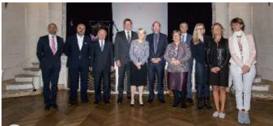
Le Président du Parlement et des membres du Bureau, la Présidente du Parlement Jeunesse et la Déléguée générale

mise en place du Parlement Jeunesse, une véritable initiation à la démocratie.