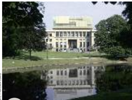
Maison de l'histoire européenne

La Galerie de l'Homme inaugurée en mai 2015 permet d'explorer notre évolution et notre corps, que ce soit de Sahelanthropus à Homo-Sapiens, comme de l'embryon à l'adulte. Une salle, trois espaces, trois sujets sont mis en relation pour expliquer d'où l'on vient et qui nous sommes. Une façon inédite d'expliquer l'évolution de l'Homme et de son corps. On commence la visite par les fossiles et reconstitutions 3D qui mènent sur