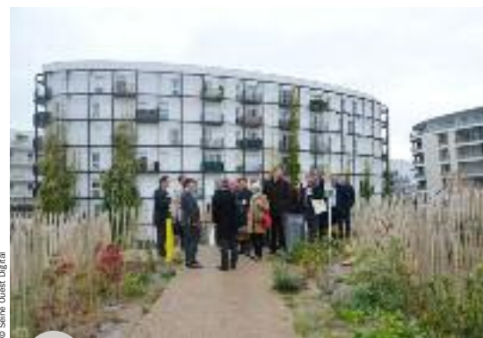
Visite de l'Éco-Fort d'Issy

La délégation a ensuite visité plusieurs projets « smart » de la ville d'Issy-les-Moulineaux et rencontré les différents acteurs qui ont participé à leur réalisation. Notamment : Le Cube, pionnier sur la scène culturelle numérique française, lieu de référence pour l'art et la création numérique pour tous ; Le Quartier de l'Éco-Fort d'Issy qui a pour ambition d'illustrer l'habitat du XXI e siècle sous toutes ses formes ; IssyGrid, réseau d'avant-