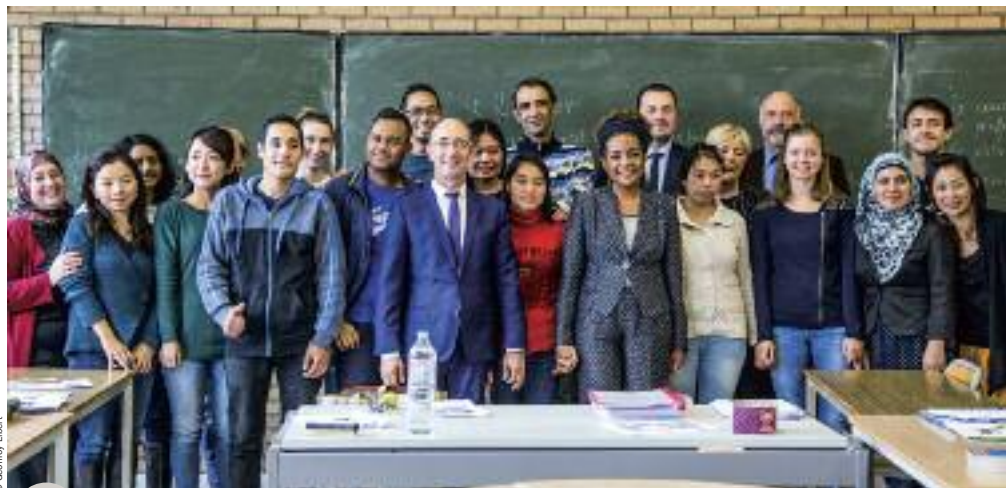
La Secrétaire générale et le Ministre-Président en compagnie d'élèves de l'Institut d'Auderghem