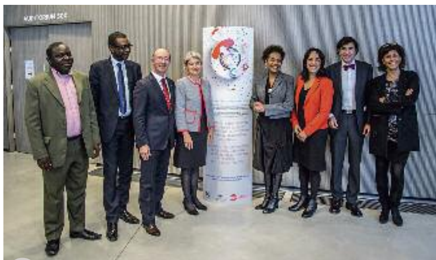
Youssou N'Dour, Rudy Demotte, Irina Bokova, Michaëlle Jean, Fadila Laanan, Elio Di Rupo et Joëlle Milquet

La Directrice générale de l'Unesco, Madame Irina Bokova, la Secrétaire générale de la Francophonie, Madame Michaëlle Jean, et de nombreuses personnalités, ministres, artistes de renom, représentants de la société civile des pays du Nord et du Sud, tels que les cinéastes Nabil Ayouch, Jaco Van Dormael et Thierry Michel, ou le chanteur, à présent Ministre, Youssou N'Dour, ont participé à cette rencontre aux côtés du Ministre-Président de la Fédération Wallonie-Bruxelles, Rudy Demotte, du Bourgmestre de la Ville