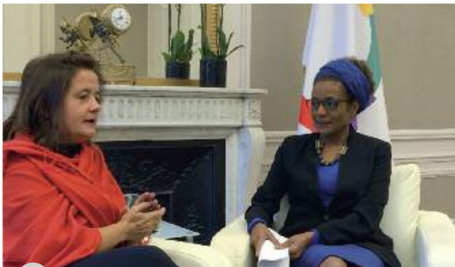
La Présidente du Parlement reçue par la Secrétaire générale de la Francophonie

concrètes d'engagement en faveur des réfugiés.