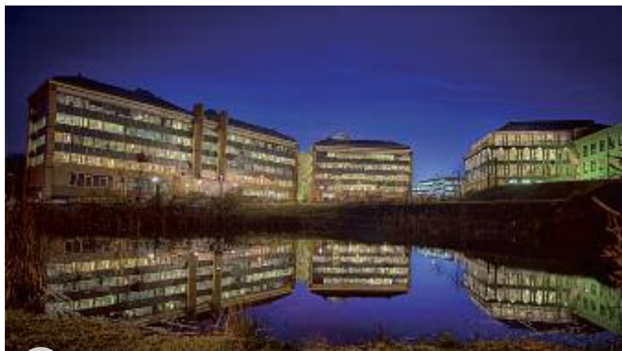
Le siège de Taktik

Taktik se positionne donc comme éditeur de logiciels et fournisseur de solutions complètes sur le marché en indirect, au travers d'un réseau de partenaires intégrateurs agréés et certifiés. Pour apporter la meilleure réactivité possible à leurs clients, la société s'est développée à l'international avec l'appui de l'Awex. Après le Luxembourg, les Pays-Bas, les Etats-