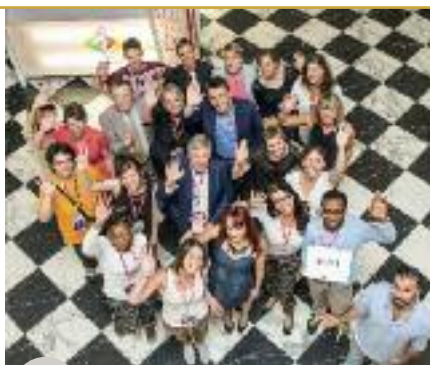
L'équipe du FMLF autour du Commissaire général, Philippe Suinen

130 projets concrets ont été débattus. Ils ont mis en évidence le dynamisme et la richesse de la langue française à travers laquelle s'exprime la formidable créativité des jeunes et de la société civile. Tous ces projets ont montré la capacité d'innovation