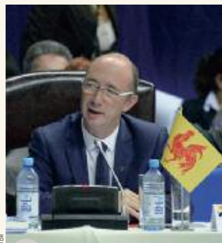
Intervention du Ministre-Président Rudy Demotte

Cette rencontre a également permis de découvrir le patrimoine exceptionnel d'un pays, d'une ville et d'apprécier