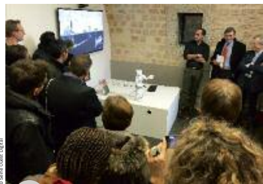
Dialogue avec Nao dans le très bel Espace Le Temps des cerises