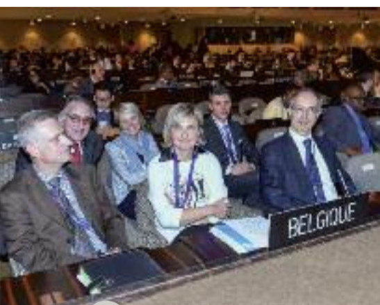
La délégation belge conduite par la Ministre Hilde Crevits

La 38 e session de la Conférence générale (CG) de l'Unesco a tenu ses assises à Paris du 3 au 18 novembre.