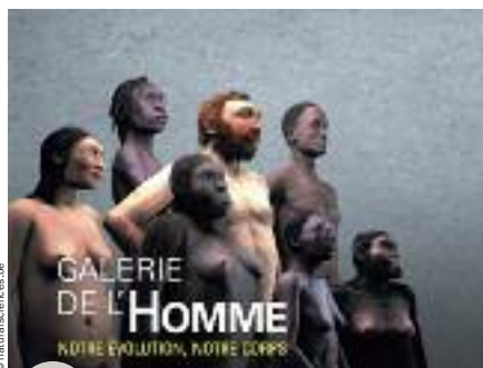
Galerie de l'Homme au Muséum des Sciences naturelles