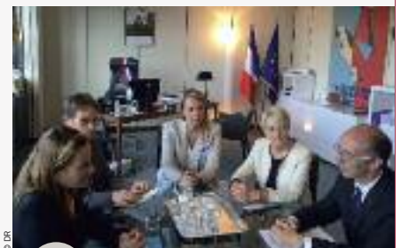
Échanges entre la Ministre Axelle Lemaire et le Ministre-Président Rudy Demotte

M. Demotte a participé à plusieurs ateliers qui associaient des experts internationaux et des représentants de grandes entreprises françaises afin d'identifier les meilleures solutions pour le développement de l'Eurométropole dans une vallée du numérique via des collaborations: open data, télécommunications et mobilité. En marge de cette rencontre, le Président de l'Eurométropole a été reçu par la Ministre Axelle Lemaire.