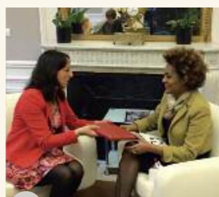
La Secrétaire générale et la Ministre Laanan