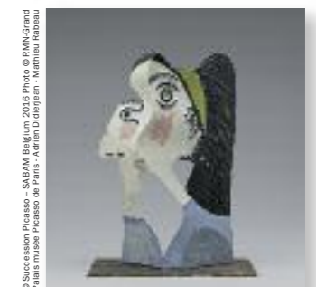
Tête de femme, 1962, Musée national Picasso-Paris

07/10/2016 – 22/01/2017 Bozar, Bruxelles Cette exposition jette un nouveau regard sur un aspect moins connu de l'œuvre de Pablo Picasso : la sculpture. Bozar expose, en collaboration avec le Musée national Picasso-Paris, environ 80 pièces sculptées de l'artiste ainsi que des peintures, céramiques et figurines ethnographiques issues de sa collection privée. www.bozar.be