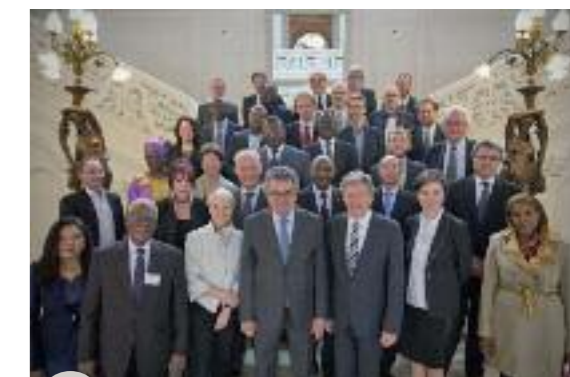
Le Groupe reçu à la Mairie de Poitiers