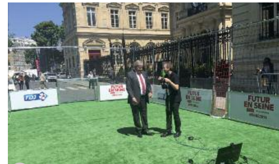
Le Ministre se prête au jeu sur le « playground »

D u 9 au 19 juin la Wallonie a été mise à l'honneur en tant que partenaire privilégié de l'édition 2016 du Festival Futur en Seine, l'un des plus grands festivals d'Europe du numérique, organisé par le Pôle Cap Digital. Un Festival de haut niveau au programme dense et ambitieux, ouvert par le Chef de l'État et la Présidente de la Région Ile-de-France