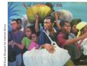
Le chemin de l'exil, Chéri Chérin, Kinshasa, 2004

07/10/2016 – 22/01/2017 Bozar, Bruxelles Au même titre que la musique et la danse, la peinture populaire est intimement liée à la vie quotidienne en République démocratique du Congo. Portraits, paysages et peintures allégoriques y côtoient des toiles d'inspiration urbaine et historique, suscitant une réflexion critique sur la religion, la politique et les problèmes sociaux, souvent teintée d'une légère touche humoristique.