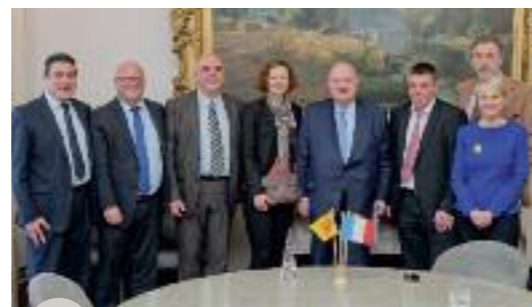
Le Député-Maire André Santini et son équipe entourés de la Délégation wallonne