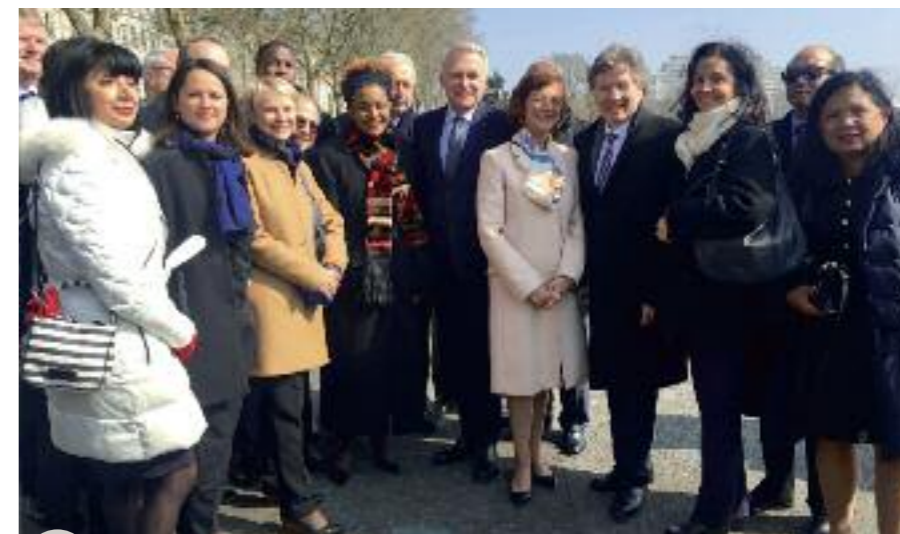
Les membres du Gaff, la Secrétaire générale, le Ministre des Affaires étrangères, le Maire de Nantes et la Conseillère à la Francophonie

À Poitiers, la Francophonie numérique. Poitiers a accueilli les 12 et 13 mai le colloque « Innovation numérique et francophonie » organisé par le Gaff et le Grand Poitiers, en collaboration avec l'Agence universitaire de la francophonie (AUF) et l'Organisation internationale de la Francophonie (OIF). Il avait pour ambition de diffuser le plus largement possible les valeurs et opportunités portées par la Francophonie