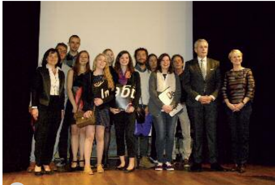
Le Ministre Annick Girardin, les jeunes photographes, le Ministre Christophe Lacroix, la Déléguée générale

Les 4 et 5 avril 2016, une délégation de la Commission Economie et Innova-