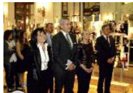
Les Ministres Annick Girardin et Christophe Lacroix, la Déléguée générale et l'Ambassadeur de Belgique