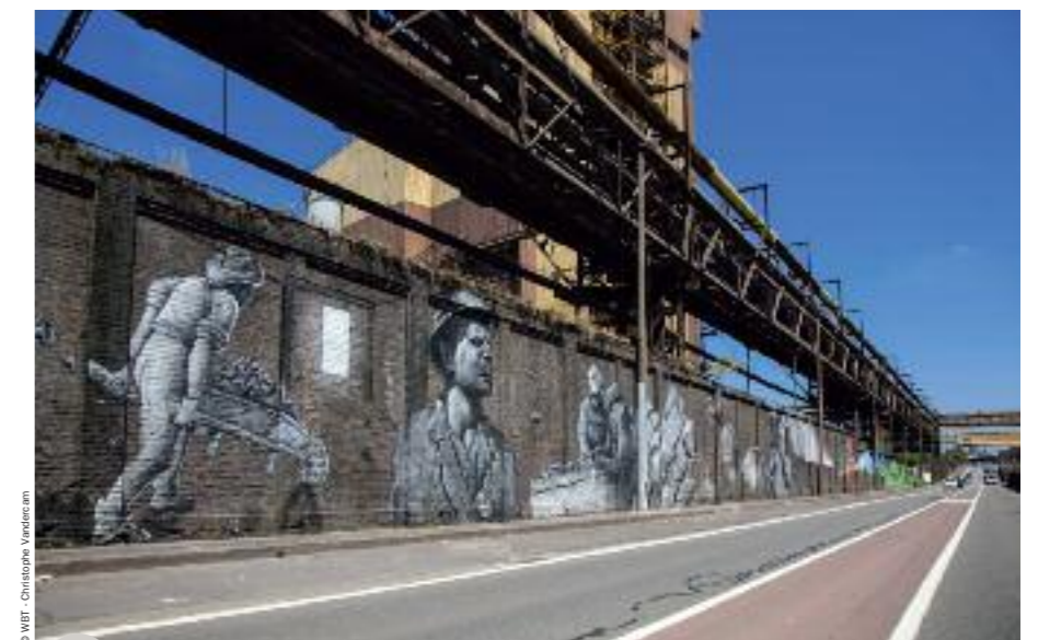
Fresque d'art urbain