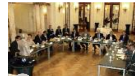
Ouverture de la séance de travail

Les Recteurs de l'Université libre de Bruxelles, l'Université catholique de Louvain, l'Université de Liège et l'Université de Namur accompagnés de la Secrétaire générale du F.R.S-FNRS et du Président de la commission des relations internationales de l'ARES (Académie de recherche et d'enseignement supérieur) se sont rendus à Paris pour rencontrer leurs homologues canadiens dans le but d'envisager de nouvelles pistes de collaboration pour la recherche, la mobilité des étudiants et chercheurs, et les mécanismes de cotutelle pour les doctorats. La rencontre était organisée par Wallonie-Bruxelles International et son agent de liaison scientifique au Canada. À l'initiative du Conseil des Recteurs des Universités de la Fédération Wallonie-Bruxelles (CREF), la Délégation générale Wallonie-Bruxelles à Paris a accueilli le 30 juin cette première rencontre avec le regroupement des 15 universités de recherche du Canada (U15).