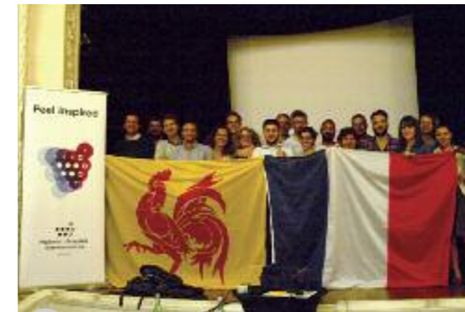
Les jeunes fêtent la fin du Nest'in