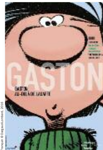
Franquin © Daguerre/Lombard, 2016

07/12/2016 - 10/04/2017 Bibliothèque publique d'information, Centre Pompidou Exposition « Gaston : au-delà de la gaffe » à la Bibliothèque du Centre Pompidou. Apparu pour la première fois le 28 février 1957 dans les pages du Journal de Spirou , Gaston Lagaffe fête ses 60 ans en 2017. www.bpi.fr