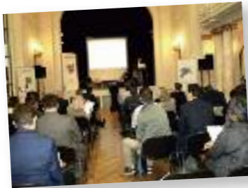
La conférence transmédia à la DGWB

Dans le cadre de notre participation au « off » de Futur en Seine, les chercheurs dans le secteur média des universités et hautes écoles de la Fédération Wallonie-Bruxelles ont participé le 14 juin à une mission technologique organisée par la Délégation générale et WBI qui avait comme objectif la visite des laboratoires et la rencontre des chercheurs de l'École des Mines de Paris, l'Institut Carnot Inria et l'Institut de recherche SystemX, centre de recherche du pôle de compétitivité francilien Systematic.