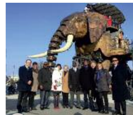
Nantes, ville du numérique, « Les Machines de l'île »