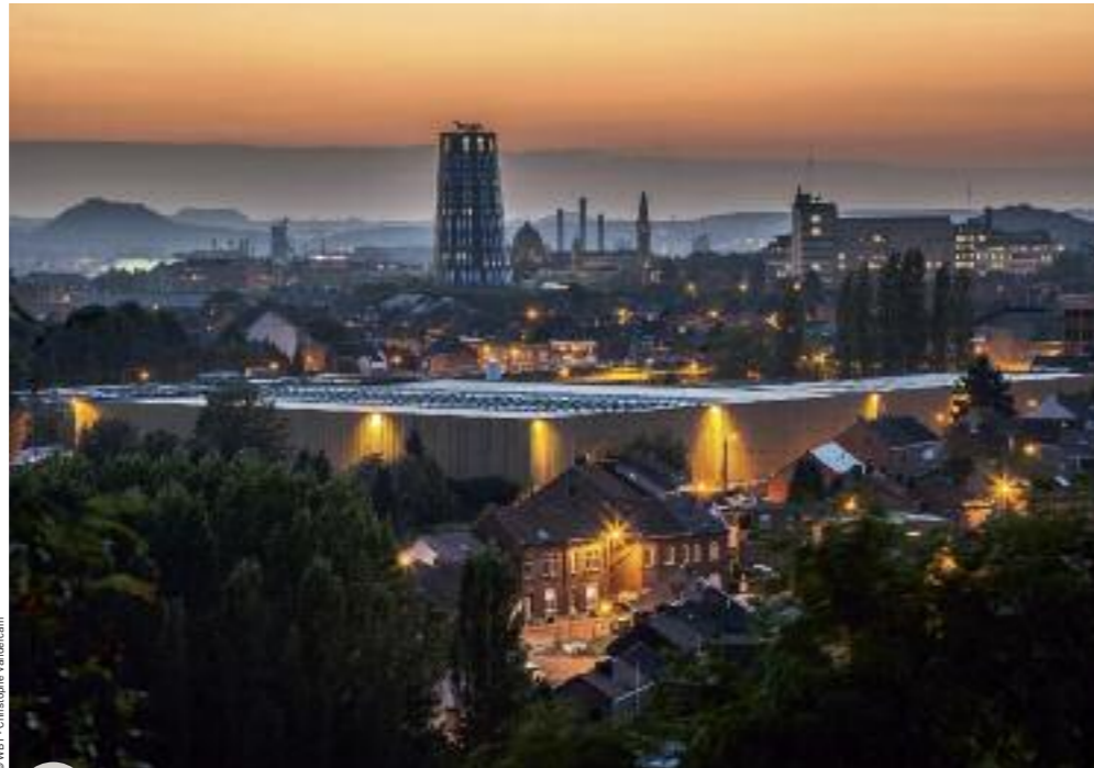
Charleroi – Panorama