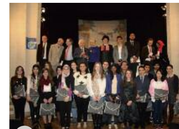
Les jeunes lauréats, les organisateurs et partenaires

Dans le cadre de la semaine de la langue française et de la Francophonie, l'association «Actions pour promouvoir le français des affaires» a organisé, à la Délégation générale Wallonie-Bruxelles, le jeudi 17 mars, sa 28 e journée du français des affaires et la remise des Mots d'or de la Francophonie à 16 lauréats venus de douze pays francophones. Comme chaque année, l'Organisation Internationale de la Francophonie, l'Agence Universitaire de la Francophonie, le Ministère des Affaires étrangères et du Développement international, le Ministère de l'Education nationale, de l'Enseignement supérieur et de la Recherche, le Ministère de la Culture et de la Communication, la Délégation générale à la langue française et aux langues de France étaient partenaires de cette très belle rencontre qui met à l'honneur les jeunes, leur esprit de créativité et leur audace!