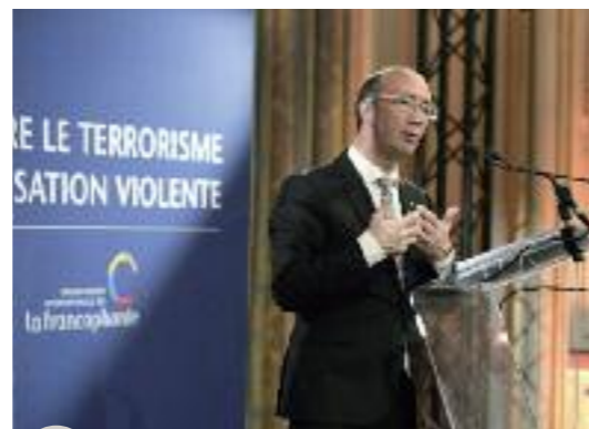
Le Ministre-Président, Rudy Demotte

se sont toujours mobilisés contre toutes les exclusions. Dès janvier 2015, bien avant les attentats de Bruxelles de mars 2016, le Gouvernement de la Fédération Wallonie-Bruxelles a été le premier Gouvernement en Belgique à adopter une stratégie préventive contre le radicalisme à travers la mise en place de nombreuses mesures destinées à renforcer la cohésion sociale. Intervenant lors de la cérémonie d'ouverture, aux côtés de ses collègues africains et de la Secrétaire générale, le Ministre-Président, Rudy Demotte, en rappelant les décisions de son Gouvernement, a permis de bien positionner l'expertise de la FWB dans ce domaine. Plusieurs experts issus des institutions relevant de la Fédération Wallonie-Bruxelles ou du Gouvernement fédéral