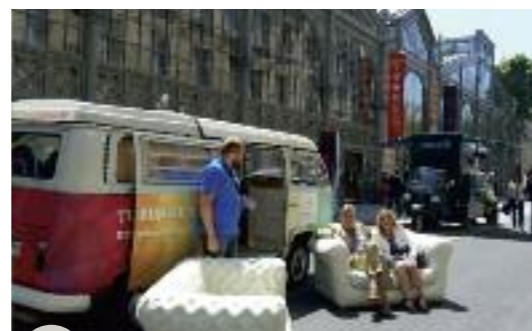
Le van de Creative Wallonia

et chacun a pu partager avec les autres exposants présents. Une belle expérience sans nul doute, et qui fut très largement relayée en Belgique et ailleurs sur tous les réseaux sociaux par l'équipe de Creative Wallonia, dont les web journalistes ne rataient rien.