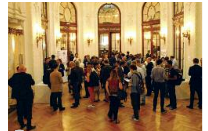
La soirée internationale