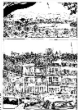
Pianche extraite de Les mystères de Tana