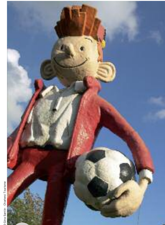
Spirou, figure emblématique de l'École de Marcinelle

Peu de villes en Europe connaissent une mutation aussi profonde que celle que vit aujourd'hui Charleroi, et c'est par la collaboration entre tous les acteurs : créateurs, chercheurs, entrepreneurs, pouvoirs publics, qu'est menée à bien une démarche permettant ce que son Bourgmestre, Paul Magnette, définit comme «la grisante aventure de la réinvention d'une cité».