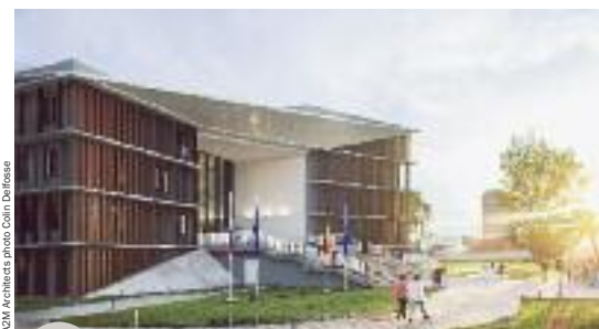
A2M Architects