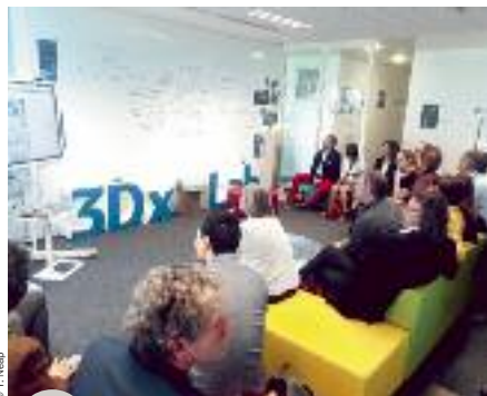
Visite de 3D Dassault Systèmes

Le matin, une délégation d'une vingtaine d'entreprises et centres de recherche wallons s'est rendue à Vélizy pour visiter le laboratoire 3D de Dassault Systèmes et y découvrir l'espace playground et son hub d'innovation ouverte. L'après-midi, rendez-vous était donné à la Délégation générale, boulevard Saint-Germain, pour un atelier conjoint avec les membres français de Medicen. La première partie de l'atelier a porté sur la réalité virtuelle et augmentée tandis que la deuxième était centrée sur la formation numérique en santé. La composition des panels était mixte, donnant ainsi la parole à des entrepreneurs, des cliniciens et des chercheurs. Un créneau horaire spécifique a été consacré dans la journée aux porteurs de projets et aux spin-offs, qui ont eu l'opportunité de « pitcher » face à un public de partenaires potentiels. Parmi les nouveautés de cette édition 2019, un espace démo en réalité virtuelle et augmentée était installé dans une salle de la Délégation pour y proposer des expériences immersives aux participants.