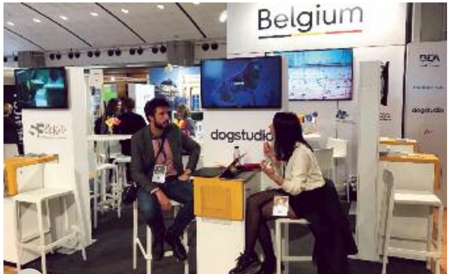
Le pavillon belge au SITEM

Fondée en 1998, l'association MSW fédère un peu plus de 170 acteurs situés en Wallonie, relevant du patrimoine mobilier de Wallonie comme de son patrimoine immobilier, immatériel, du tourisme ou encore de l'éducation. Elle a notamment pour objectifs leur professionnalisation, leur promotion et leur valorisation dans le cadre de la politique touristique wallonne.