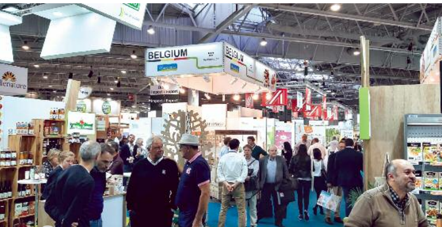
Natexpo, le salon international des produits biologiques

Parmi les nouveautés chez Happy People Planet, de délicates truffes au chocolat noir bio déclinées au thé vert matcha japonais, aux spéculoos ou à la poudre de cacao et des réglisses enrobées de chocolat bio.