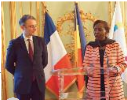
L'Ambassadeur de Roumanie et la Secrétaire générale de la Francophonie