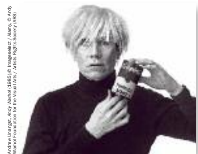
Andrew Unangst, Andy Warhol (1985) © Imagesselect / Alamy © Andy Warhol Foundation for the Visual Arts / Artists Rights Society (ARS)

Le pape du Pop art sera aux cimaises de La Boverie avec l'exposition événement Warhol – The American Dream Factory . Balayant la carrière de l'artiste, elle rassemble les œuvres les plus célèbres d'Andy Warhol, provenant des plus grands musées du monde et de collections privées de premier rang, tout comme des documents rares exposés pour la première fois. De quoi dessiner un portrait vivant de 40 ans d'histoire de cette Amérique dont l'artiste a su capter l'âme comme nul autre de ses contemporains. www.warhol-factory.be