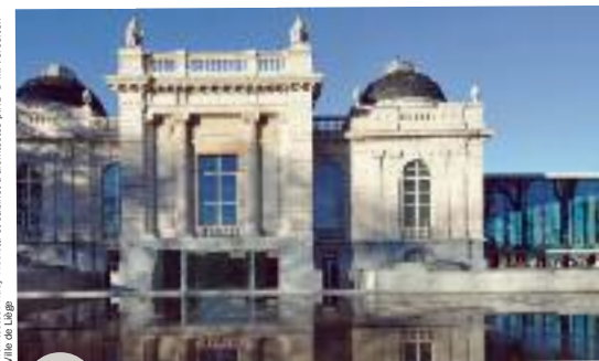
Architectes: Rudy Recenti et cabinet d'architectes p.HD