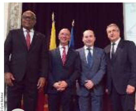
Le président de l'Assemblée nationale du Cap vert, le président du Parlement, le délégué général et le ministre-président