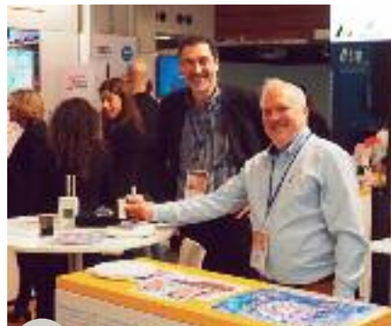
L'équipe de Codine