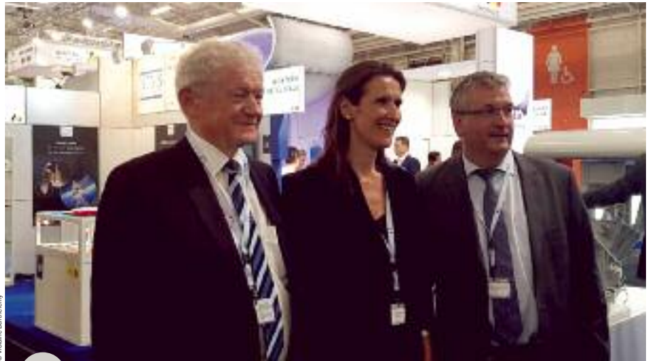
François Bellot, Sophie Wilmès, et Pierre-Yves Jeholet

Plus de 80 entreprises belges dont 54 wallonnes étaient présentes au 53 e Salon international de l'Aéronautique et de l'Espace qui s'est déroulé du 17 au 23 juin 2019 à Paris-Le Bourget. Trois ministres avaient fait le déplacement lors de la journée belge : François Bellot, ministre fédéral de la Mobilité, Pierre-Yves Jeholet, ministre du Gouvernement wallon en charge de l'Économie et de l'Industrie, et Sophie Wilmès, ministre fédérale du Budget, de la Fonction publique et de la Politique scientifique. Le 19 juin, ils ont rencontré des entreprises belges, de tailles très diverses, actives dans l'aéronautique, le spatial, l'informatique, l'armement et les produits technologiques. La plupart de ces entreprises étaient rassemblées au sein du stand Belgian Aerospace.