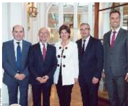
Le délégué général, le président du Parlement, l'administratrice de l'OIF, le ministre-président et le délégué général adjoint