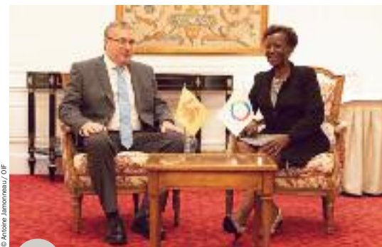
Rencontre entre la Secrétaire générale de la Francophonie, Louise Mushikiwabo et le ministre-président