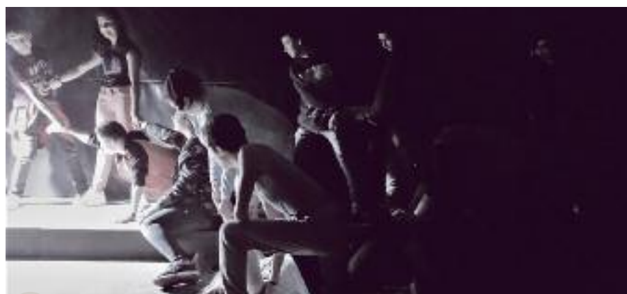
« Paix », le concours de la jeunesse au service de la Paix