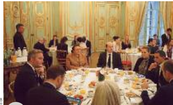
Rencontre avec le secrétaire d'État, Jean-Baptiste Lemoyne