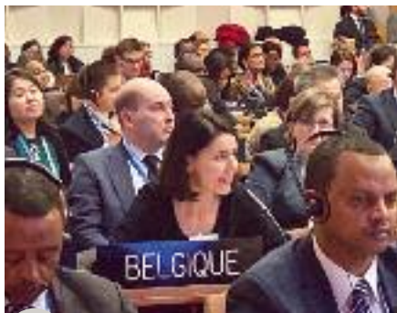
Valérie Glatigny, ministre de l'Enseignement supérieur