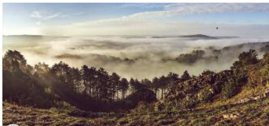
Paysage du Géoparc Famenne-Ardenne

Plus d'informations : www.geoparkfamenneardenne.be