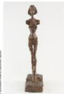
© Succession Alberto Giacometti / Sibam

35 chefs-d'œuvre en bronze accompagnés d'une sélection exceptionnelle de lithographies issues de la publication mythique Paris sans fin . Cette exposition propose une lecture de l'œuvre d'après-guerre de l'artiste à travers le contexte historique et la vision existentialiste de Jean-Paul Sartre qu'Alberto Giacometti rencontre vers 1940. Le philosophe déclare que Giacometti ne tente pas de représenter l'être, mais l'apparence extérieure de ses modèles. En les sculptant à une certaine distance, il accepte instantanément la relativité et trouve ainsi l'absolu. www.citemiroir.be