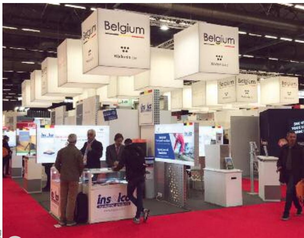
Pavillon Awex à Batimat 2019

Aluthermo, à Saint-Vith, a développé un isolant mince réfléchissant, composé de plusieurs couches d'aluminium qui enferme de l'air sec dans ses films intérieurs. Nouvelle référence en matière de confort, il combine de