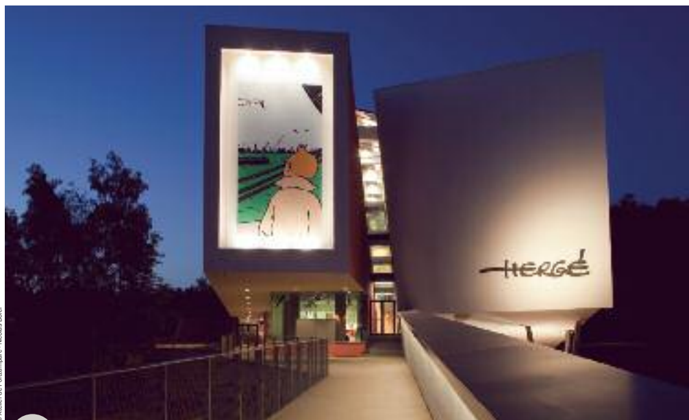
Musée Hergé, Louvain-La-Neuve