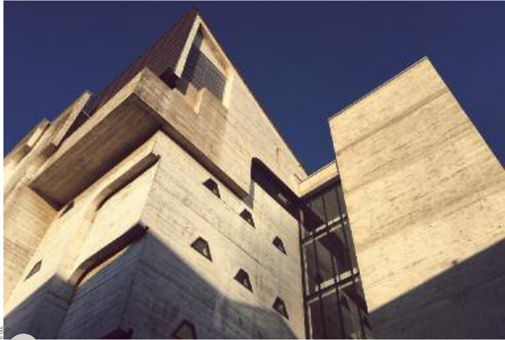
Musée L à Louvain-la-Neuve

En 2016, Liège a ouvert La Boverie, à la fois musée des beaux-arts et centre d'expositions de renommée internationale. Un site au cœur de l'axe Guillemins - Médiacité, rythmé par les plus grands architectes : la gare TGV a été dessinée par Santiago Calatrava, le centre commercial, audiovisuel et de loisirs Médiacité a été conçu par Ron Arad, et La Boverie est le fruit du travail de l'architecte Rudy Ricciotti et du Cabinet liégeois p.HD. En quatre ans, La Boverie s'est affirmée comme un fleuron de la culture wallonne. Après une belle exposition sur l'Hyperréalisme, une exposition événement « Warhol - The American Dream Factory » vous y attend au dernier trimestre 2020.