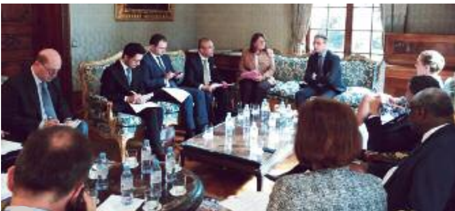
Le Groupe des Ambassadeurs francophones de France