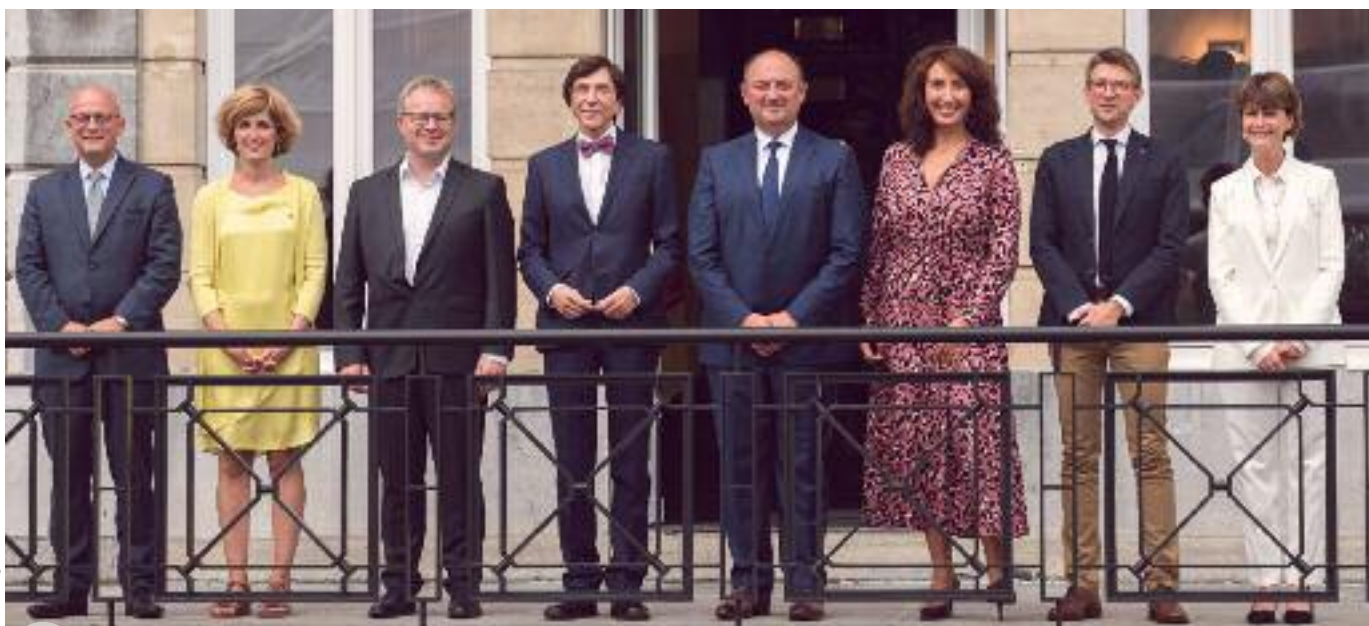
Jean-Luc Crucke, Céline Tellier, Philippe Henry, Elio Di Rupo, Willy Borsus, Christie Morreale, Pierre-Yves Dermagne, Valérie De Bue

Le 13 septembre 2019, les nouveaux gouvernements de Wallonie et de la Fédération Wallonie-Bruxelles ont été constitués. Ils sont tous les deux composés d'une coalition tripartite socialiste (PS), libérale (MR) et Ecolo.