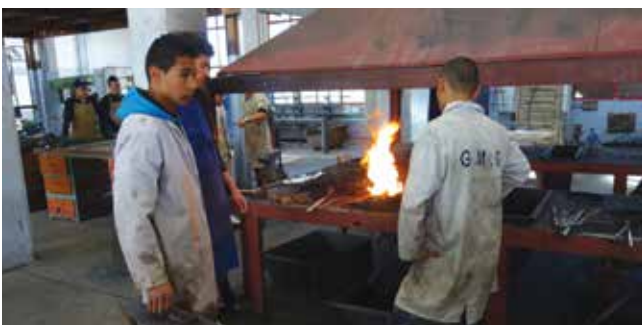
Atelier de fonderie du Centre de Formation aux Métiers d'Arts de Nabeul

Cinq projets relèvent d'une approche de formation technique ou professionnalisante dans différentes régions de Tunisie. Ils portent tant sur le partenariat interentreprises entre PME des secteurs agro-alimentaire et textile, sur la formation des métiers d'art (céramique, verre et ferronnerie) à Nabeul que sur la formation à l'entrepreneuriat entre le Forem de Wallonie et l'Agence tunisienne du travail indépendant (ANETI). Un nouveau projet traite du processus