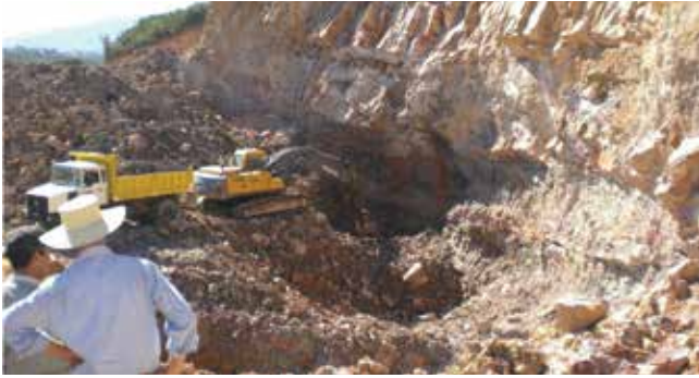
Exploitation d'argiles dans les environs de Tabarka

ventions à travers la complémentarité de deux projets de recherche sur la gestion de la qualité et des flux d'eau dans le bassin versant de la Medjerda face aux défis des changements climatiques. Dans le domaine de l'eau encore, le projet sur l'amélioration des eaux usées traitées et des boues d'épuration dans leur usage agricole dans la région de Tunis sera poursuivi en concertation étroite avec toutes les parties prenantes.