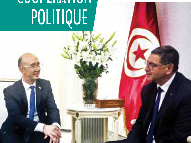
Rudy DEMOTTE, Ministre-Président de la Fédération Wallonie-Bruxelles et Habib ESSID, Chef du Gouvernement tunisien, à Tunis, mars 2015