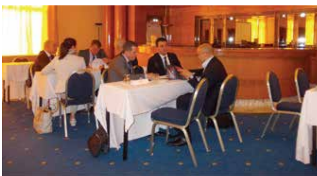
Rencontres individuelles préprogrammées