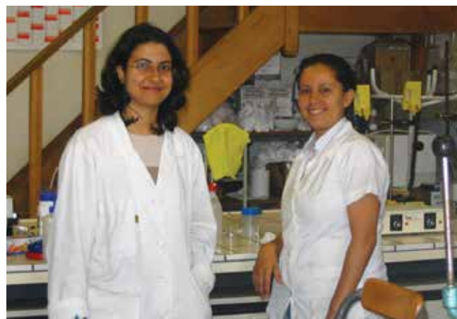
Doctorantes de l'Ecole Nationale des Ingénieurs de Sfax (ENIS) dans un laboratoire Agro-Biotech à Gembloux