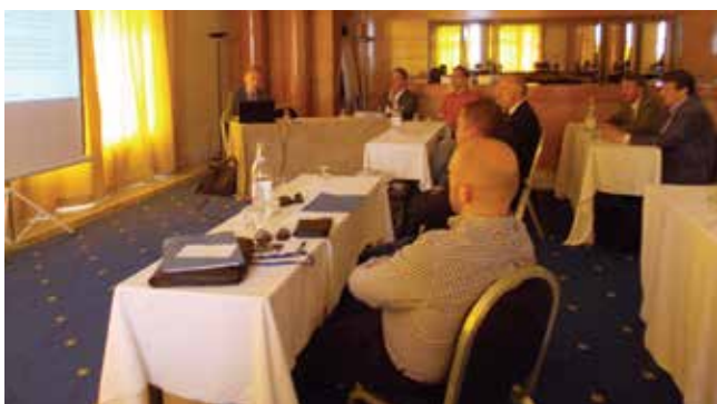
Briefing sur le déroulement de la mission et exposé « Tendances récentes du marché tunisien »

Lors de cet événement, la Représentation Economique et Commerciale de l'Ambassade de Belgique a organisé plus de 100 rendez-vous individuels (rencontres B2B) pour les sociétés luxembourgeoises.