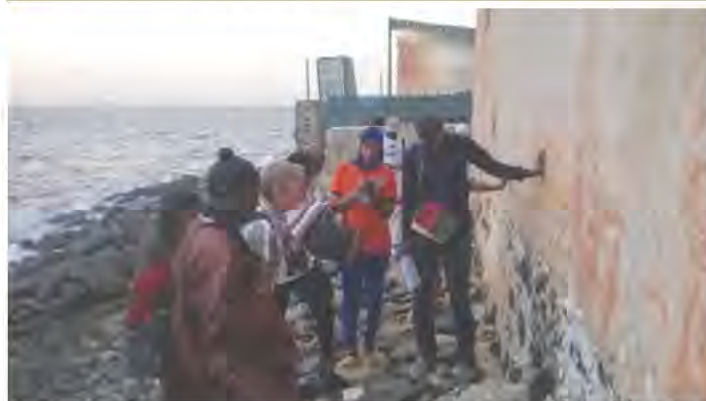
Atelier de consolidation du mur arrière de la Maison de l'Amiral à Gorée