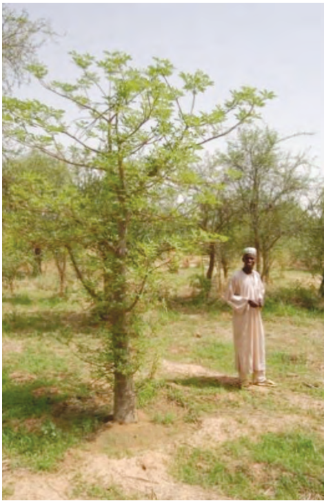
Aboulaye Dicko, producteur à Djibo

La plupart des espèces utilisées sont des espèces locales et répondent à des besoins écologiques, économiques et/ou alimentaires. Le Baobab ( Adansonia digitata ) est par exemple largement utilisé dans la zone d'intervention pour ses feuilles, qui sont comestibles, et son fruit, source de revenu à travers la poudre de pain de singe transformable en boissons. L' Acacia Nilotica et l' Acacia senegal sont utilisés pour la réalisation de haies vives et la protection des berges des cours d'eau. L'acacia du Sénégal