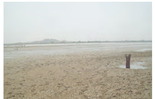
Accumulation de sédiments dans la cuvette de la retenue de Mogtedo en assec chaque année

Le Programme d'Appui au Développement de l'Irrigation (PADI) a pour objectif d'améliorer les capacités techniques des structures impliquées dans la mise en œuvre de la Stratégie Nationale de Développement Durable de l'Agriculture Irriguée (SNDDAI) par le développement d'outils opérationnels et par le renforcement des compétences. Ces structures dépendant du Ministère de l'Agriculture et des Aménagements Hydrauliques sont les suivantes :