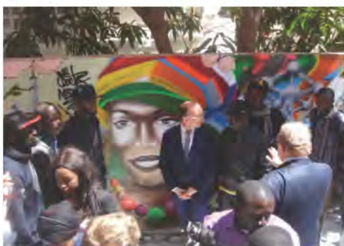
Inauguration de la fresque par le M-P Demotte