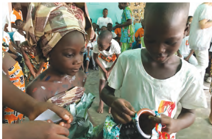
Enfants accueillis par Terre Rouges

De manière générale, en matière d'accompagnement des enfants en danger dans la rue, la demande excède l'offre, phénomène aujourd'hui en expansion. En termes de locaux, « Terres Rouges » dispose au Bénin d'équipements permettant une prise en charge plus importante et réalise en ce moment des travaux d'infrastructure qui rendront