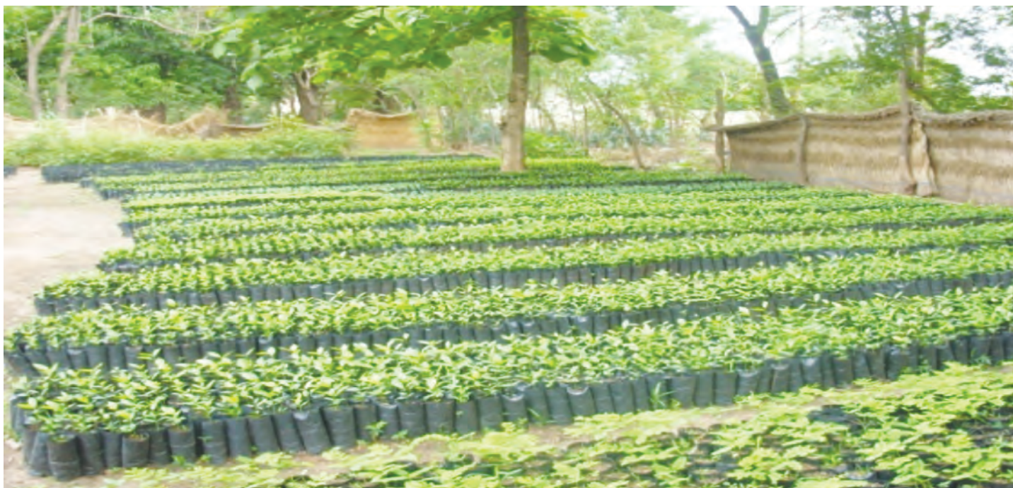
Une pépinière de production de plants forestiers

qu'en termes d'organisation, et l'élaboration et la mise en place d'une stratégie de communication. Sa première phase se termine en décembre 2016 et une nouvelle phase est en formulation pour la période 2017-2021.