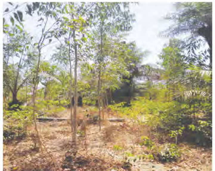
Plantation d'Eucalyptus dans le département de Oussouye

protection et restauration d'espèces menacées ; des encouragements au perfectionnement des fours afin d'aboutir à une économie réelle en bois-énergie.