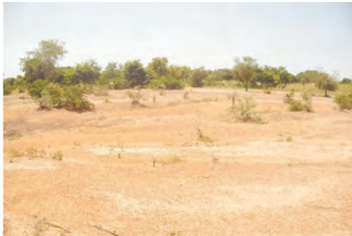
Terres dégradées dans le bassin versant de Kierma

L'envasement ou l'ensablement des retenues d'eau observé est en étroite relation avec l'état de dégradation des terres du bassin versant à l'amont de la retenue et alimentant celles-ci par des flux hydriques et sédimentaires provenant de l'érosion des sols.