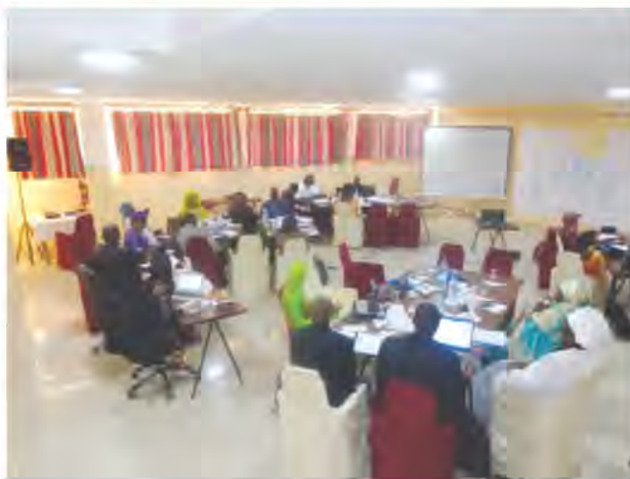
Atelier de planification du programme d'appui à l'Entrepreneuriat féminin période 2017 / 2021

Les projections programmatiques, formalisées dans un dossier technique et financier, font état des axes d'intervention suivants :