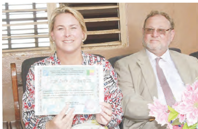
Céline FREMAULT recevant un « diplôme d'honneur » de l'école des sourds de Porto -Novo

Ces dix années passées avec Alpha-Signes grâce à la COCOF ont permis à l'école d'affermir la pédagogie des enseignants pour des résultats plus encourageants en fin d'année scolaire. Ainsi, de 2006 à 2016, l'effectif de l'école est passé de 245 à 619 élèves en raison des bons résultats aux différents examens. De 2006 à 2016, cette école a enregistré 179 sourds admis à l'examen du C.E.P. (Certificat d'Etudes Primaires) contre 112 pour les huit autres écoles pour sourds du Bénin réunies. Toujours dans la même période, 72 sourds sont détenteurs de l'examen du BEPC (Brevet d'Etudes du Premier Cycle) et sont pour la plupart du temps enseignants dans les autres écoles pour sourds du pays et de la sous-région. Grâce à la COCOF, 4 élèves ont décroché le baccalauréat et sont actuellement étudiants sur des campus universitaire, ce qui est une première dans toute l'Afrique.