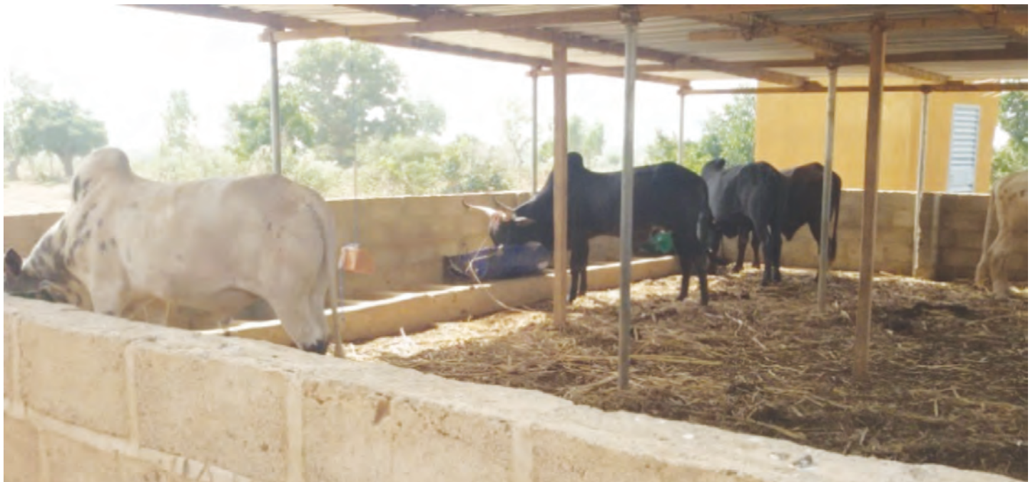
Embouche bovine en stabulation libre avec production de fumier dans la ferme école

Les formations théoriques sont appuyées de travaux pratiques réalisés dans la ferme. Un programme est élaboré pour le suivi des apprenants selon leurs différents secteurs d'activités. Des fiches techniques réalisées visent les changements climatiques, la conservation des eaux et des sols / défense et restauration des sols, la production de choux, tomates, oignons bulbes, compost, plants, la production de soumbala, épice tirée du néré, le reboisement, la Régénération Naturelle Assistée (RNA), et la formation en élevage. La ferme école aspire à se prendre elle-même en charge sur le long terme grâce à la vente des produits issus de ses activités, et les recettes sont placées sur un compte.