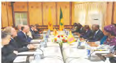
Réunion bilatérale entre le Gouvernement du Sénégal et le MP Rudy Demotte accompagné de sa délégation

Cette année 2016 est avant tout celle d'un débat proposé à toutes les parties engagées dans notre coopération. Après l'évaluation des projets réalisés dans le cadre du programme de travail 2012-2015, une nouvelle programmation s'annonce au Sénégal.