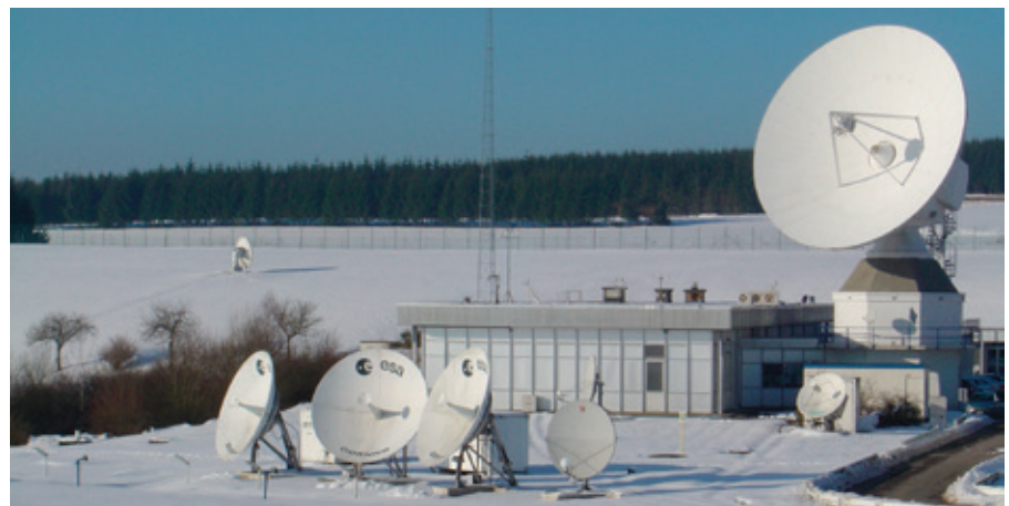
Antennes de la station terrestre ESA de Redu