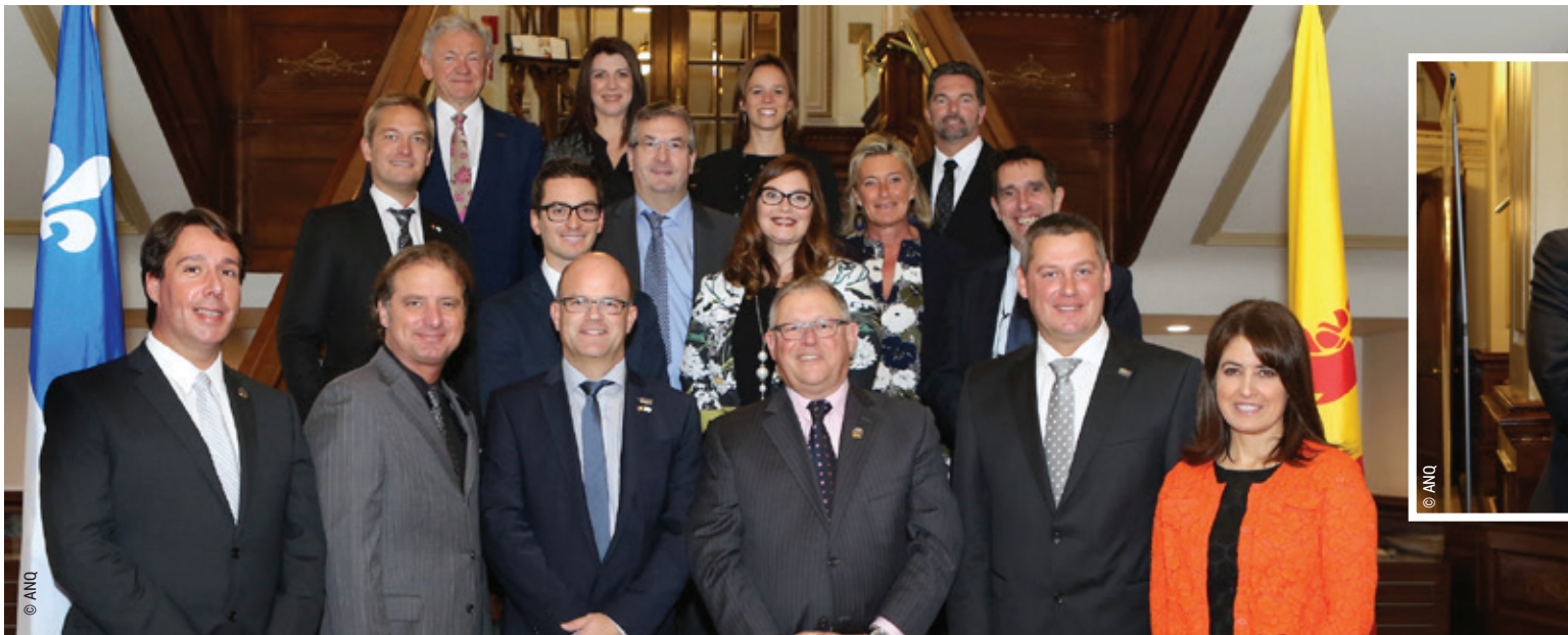
Comité mixte Assemblée nationale du Québec/Parlement de la Fédération Wallonie-Bruxelles | Photo prise en 2015 à Québec

greoli.cfwb.be/40-actions-pour-bouger-les-lignes