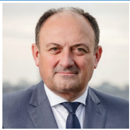
M. Willy Borsus, Ministre-président de la Wallonie

L'été n'aura pas été de tout repos pour nos gouvernements francophones. Un peu à la surprise générale, le Mouvement Réformateur (MR) et le Centre démocrate humaniste (cdH) ont abouti à un accord de gouvernement en Wallonie, avec une nouvelle politique intitulée « La Wallonie plus forte », adoptée le 25 juillet dernier. Le cdH s'est donc séparé du Parti socialiste avec qui il s'était allié depuis quatorze ans.