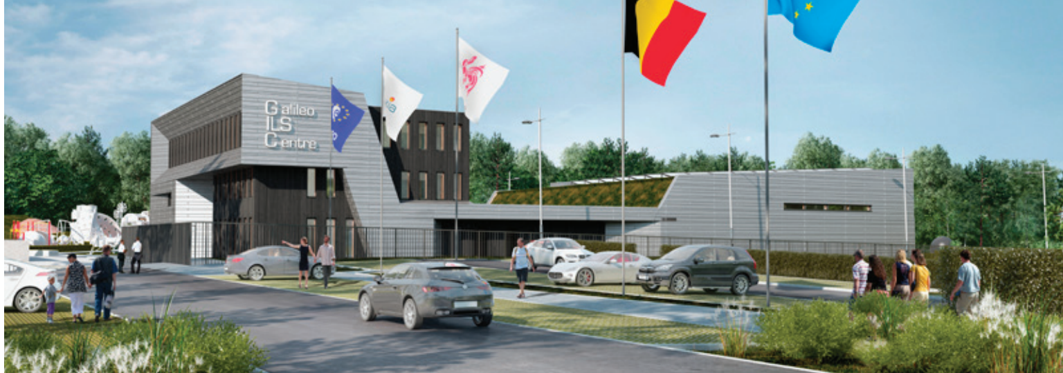
Centre ILS Galileo