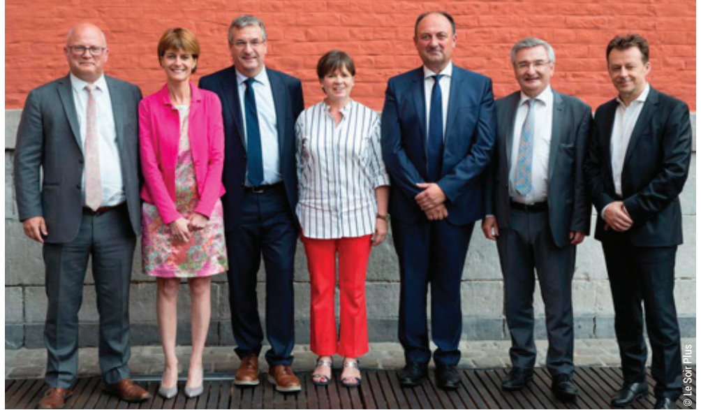
Le nouveau gouvernement wallon

L'été n'aura pas été de tout repos pour nos gouvernements francophones. Un peu à la surprise générale, le Mouvement Réformateur (MR) et le Centre démocrate humaniste (cdH) ont abouti à un accord de gouvernement en Wallonie, avec une nouvelle politique intitulée « La Wallonie plus forte », adoptée le 25 juillet dernier. Le cdH s'est donc séparé du Parti socialiste avec qui il s'était allié depuis quatorze ans.