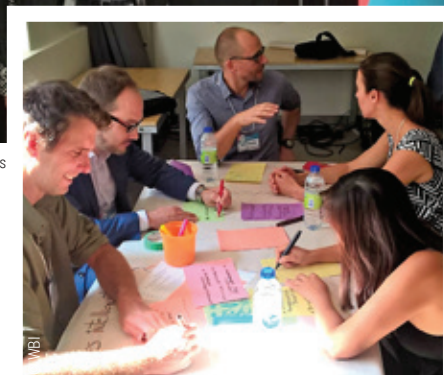
Atelier de co-création à la SAT

Une prochaine édition est prévue pour 2019, en Wallonie ou à Bruxelles.