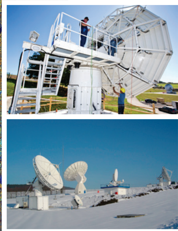
Antennes de la station terrestre ESA (ESEC)