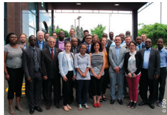
Membres du CO

Dans le cadre de l'année MAROC2018, initiée par Wallonie Bruxelles International, cinq jeunes entrepreneurs marocains ont également participé à cet événement.