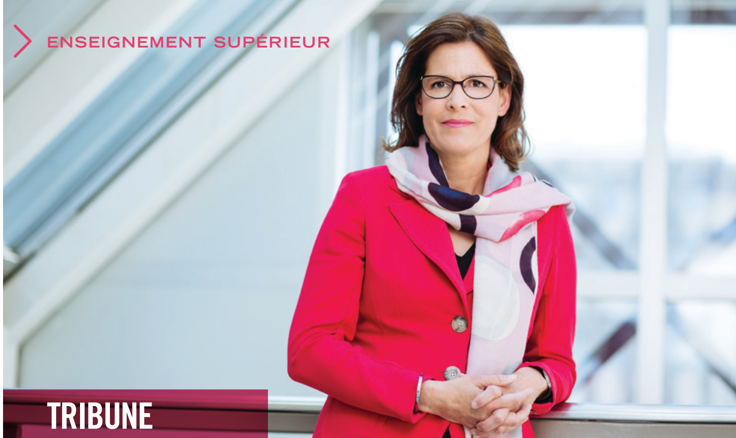
Sophie D'Amours, Rectrice de l'Université Laval