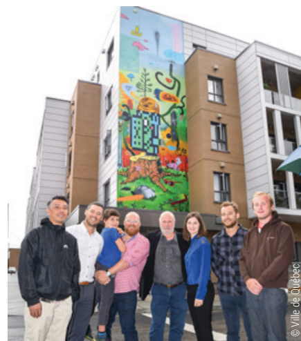
Inauguration de la murale Arbre-Phénix

Trois ans après la réalisation de la murale de Namur, c'est au tour des trois Bruxellois d'être invités à Québec pour y réaliser la murale Arbre-Phénix , conçue par Dan Brault.