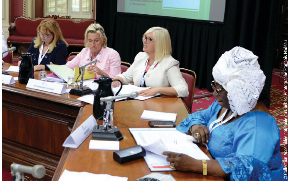
Travaux du Réseau des Femmes parlementaires de l'APF

M. Philippe Courard, Président du Parlement de la Fédération Wallonie-Bruxelles, et sa délégation étaient en mission au Québec du 5 au 10 juillet pour participer aux travaux de la 44 e session de l'Assemblée parlementaire de la Francophonie (APF). Cette session, qui avait pour thème Les bonnes pratiques des parlements à l'ère du numérique , s'est clôturée par l'adoption de 14 résolutions portant, entre autres, sur la dénonciation des agressions sexuelles, la traite des êtres humains, les données personnelles, la Francophonie économique, l'utilisation des nouvelles technologies pour l'agriculture durable.