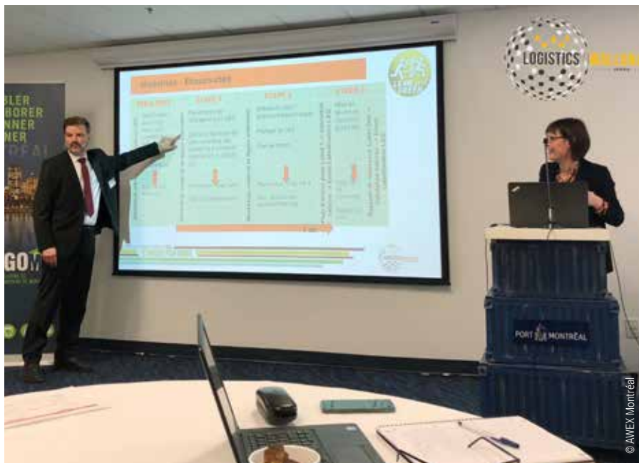
LiW à CargoM

Convaincus que ce programme répond véritablement aux attentes du secteur, CargoM et LiW ont annoncé par voie de communiqué « d'ores et déjà plancher sur les projets communs à lancer dans ce domaine : attractivité des métiers et sensibilisation aux opportunités d'emploi offertes par les activités de transport et de logistique, obtention et l'exploitation des données dans le secteur, gestion logistique du e-commerce et logistique inverse et circulaire. »