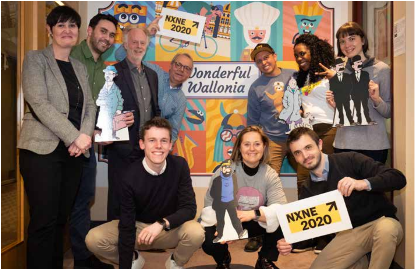
NXNE2020 - Dernière rencontre avant le confinement des équipes d'Export Québec, du Ministère de l'Économie et de l'Innovation et de l'AWEX/Wallonie-Bruxelles International à Montréal

C'est désormais une tradition, la Wallonie et le Québec se donnent chaque année rendez-vous sur de grandes manifestations internationales afin de renforcer les collaborations entre leurs acteurs économiques.