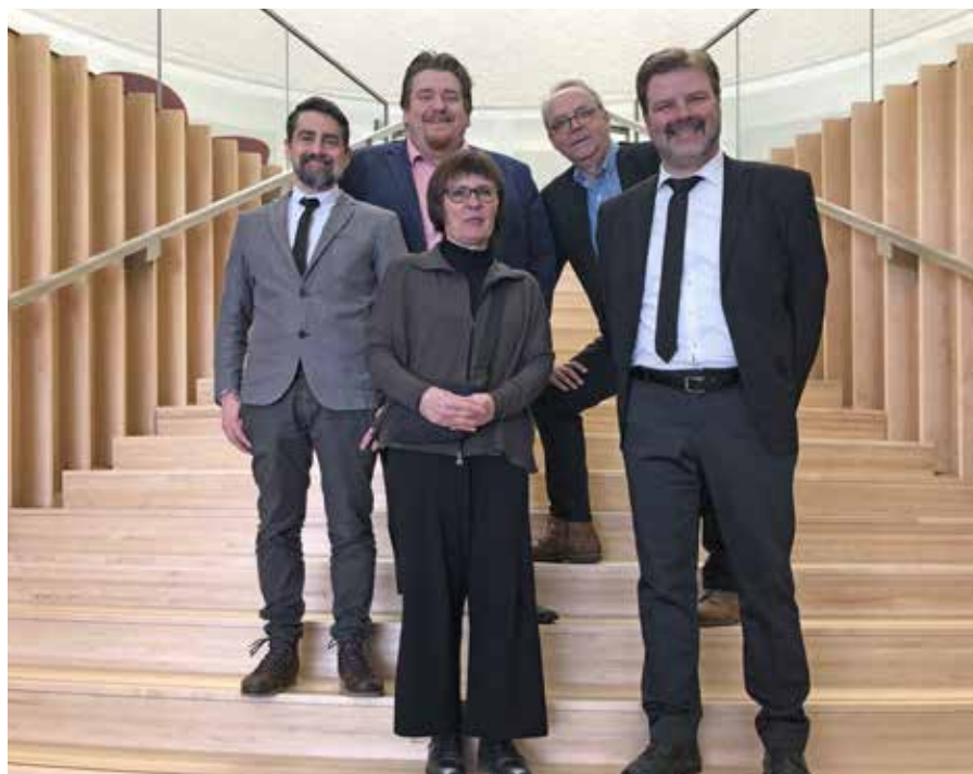
LiW au Centech

logisticsinwallonia.be cargo-montreal.ca