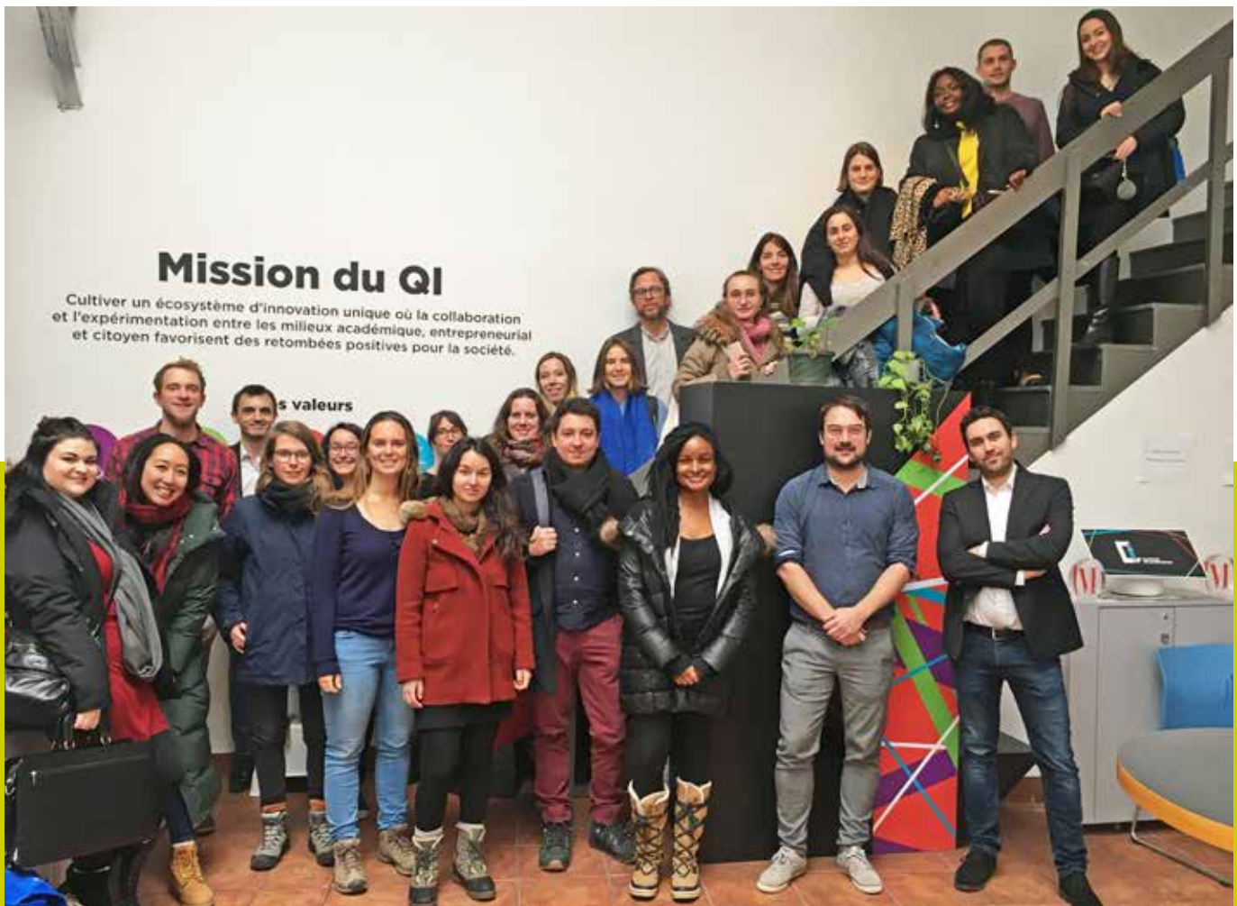
Délégation des incubateurs/accélérateurs francophones – visite du Quartier de l'Innovation