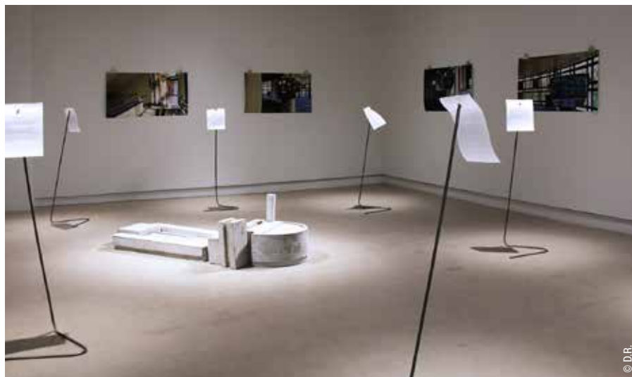
Exposition Échoué n'est pas coulé